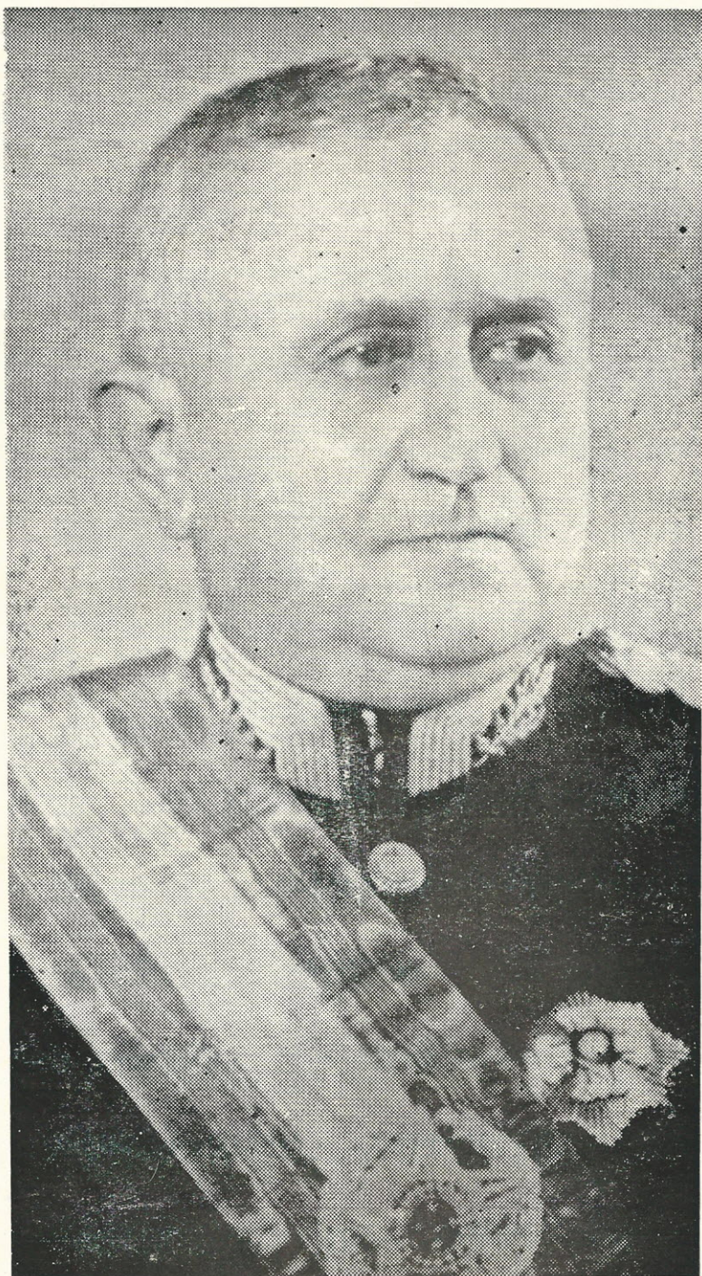
GENERAL DO EXÉRCITO EURICO GASPAR DUTRA D. D. PRESIDENTE DA REPÚBLICA E CHEFE SUPREMO DAS FORÇAS DE TERRA, MAR E AR