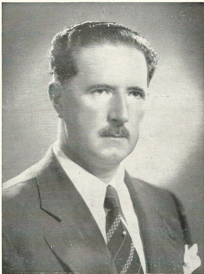
SR. DR. ADHEMAR PEREIRA DE BARROS D. D. GOVERNADOR DO ESTADO DE SÃO PAULO