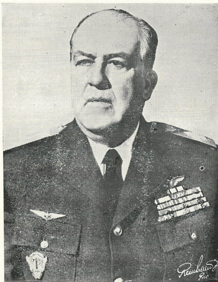
Tte. BRIGADEIRO ARMANDO FIGUEIRA TROMPOWSKY DE ALMEIDA D. D. MINISTRO DA AERONAUTICA