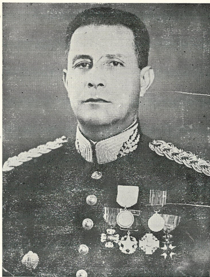
GENERAL DE DIVISÃO CANROBERT PEREIRA DA COSTA D. D. MINISTRO DA GUERRA