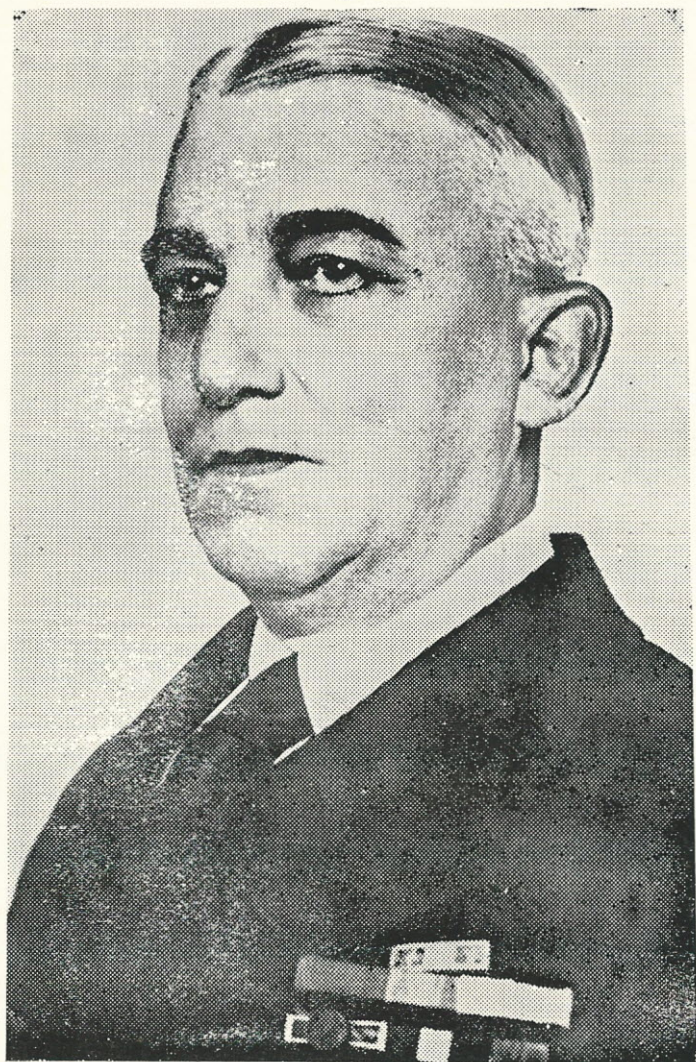
ALMIRANTE DE ESQUADRA SILVIO DE NORONHA D. D. MINISTRO DA MARINHA