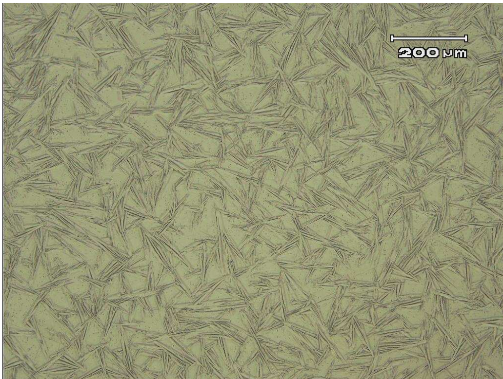
Figura 2: Metalografia da chapa de NiTi . Ataque: 30 ml de ácido acético glacial, 5ml de ácido nítrico e 2 ml de ácido fluorídrico (100 X ).

As fotografias nas Figuras 2 e 3 foram obtidas por meio da microscopia óptica onde se obtém resolução de 0,2 \mu\text{m} , sinal de luz refletida e boas imagens. Estas fotografias correspondem a amostras preparadas em seu estado de recebimento do fabricante.