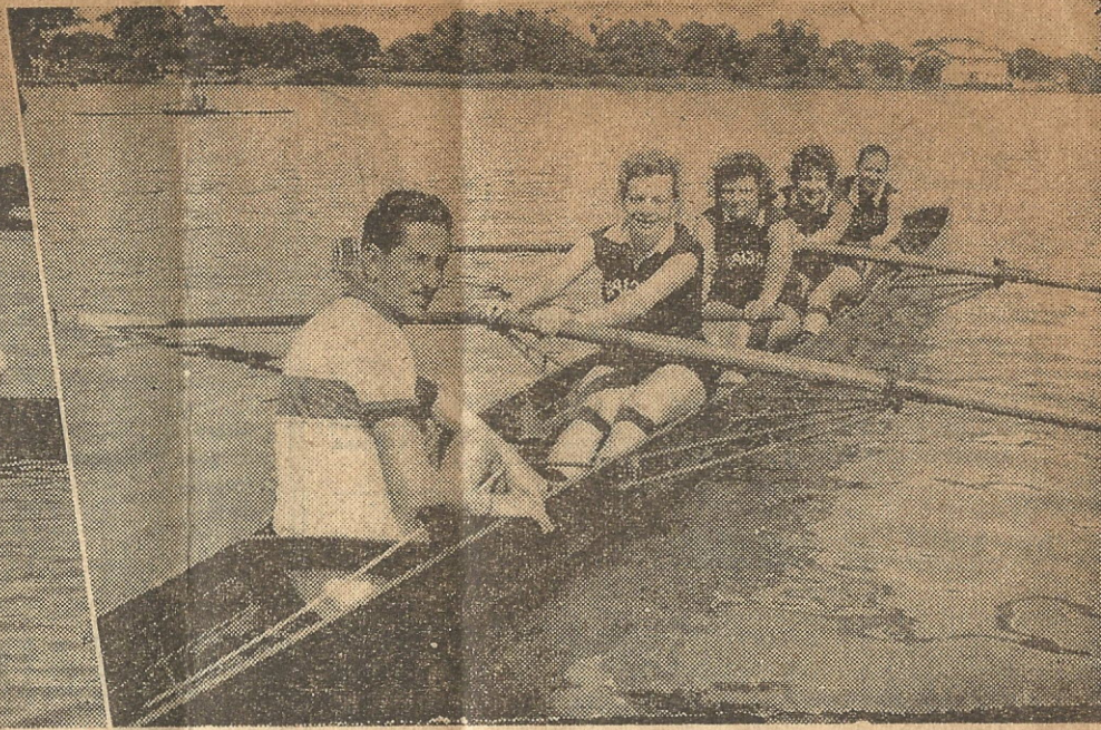
DOIS ASPECTOS da regata dos Jogos Abertos. A esquerda, a guarnição da Sogipa. A direita, a passagem na metade do percurso, quando a guarnição do Almirante Barroso ainda estava na frente. Vê-se a raia levemente encrespada. Não há a mínima marola de lancha