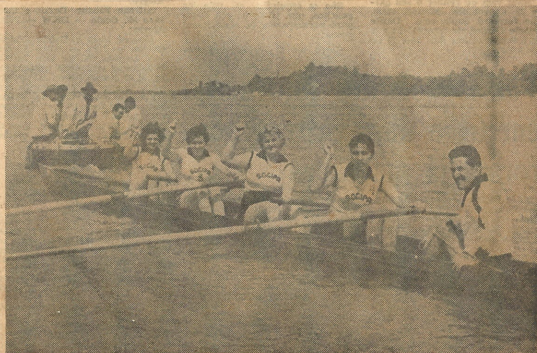
A regata a remo será realizada amanhã na raia dos Navegantes. Na foto, a equipe da Sogipa, vencedora nos três últimos jogos, quando fazia o tradicional aceno, que significa "braco é braco"