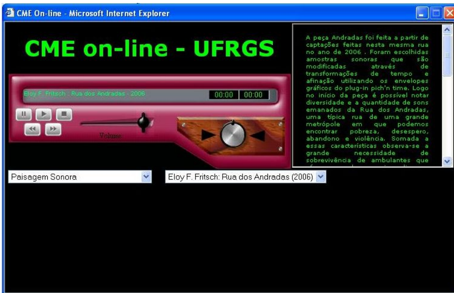
Imagem4: interface da rádio virtual do CME

Paralelamente ao projeto Música & Tecnologia, o Centro de Música Eletrônica mantém vários projetos presenciais de graduação, para alunos de composição, e de extensão para interessados, e o site EAD vem ao encontro dessas disciplinas. O site do CME ( http://www.ufrgs.br/musicaeletronica ) também desenvolve um papel nesta história, como resgate e divulgação de compositores que são referência em nosso Estado. Também serve de instrumento de divulgação do CME apresentando os laboratórios de ensino, pesquisa e extensão, além de outras atividades do CME: artigos, histórico, equipamentos, disciplinas, referências).