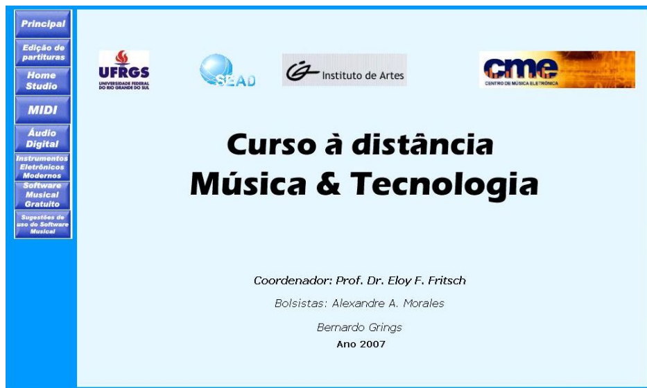
Imagem 1: Tela inicial do site

O projeto Música e Tecnologia está sendo desenvolvido no Centro de Música Eletrônica do Instituto de Artes desde o início de 2006 visando dar apoio à disciplina Música e Multimeios do curso de Pró-Licenciatura, e como material de apoio em aulas de graduação e extensão à distância dos cursos de música. O material disponibilizado (na página web: http://www.ufrgs.br/mt ) iniciou-se com o estudo, implementação e pesquisa sobre o software Finale Notepad 2006, disponível gratuitamente, para a edição eletrônica de partituras musicais. Neste processo, foi criado um tutorial de uso do programa, o qual foi disponibilizado na íntegra, e também dividido em diversos tópicos, ou aulas, que deveriam ser ministradas de forma seqüencial. Além do tutorial em si, na forma de arquivo Adobe PDF e páginas HTML, cada módulo (aula) conta com exercícios práticos, estes resolvidos como exemplo na forma de vídeo-tutoriais curtos.