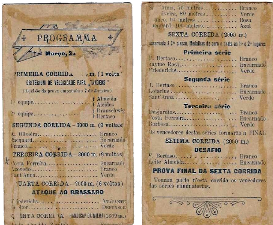
Figura 1: Programação de corridas da União Velocipedica de 25 de março de 1900.

pelo município de Porto Alegre, no Campo da Várzea. O terreno, onde hoje se situa o Instituto Parobé (Engenharia Mecânica da Universidade Federal do Rio Grande do Sul) ficava próximo a Rua Conceição, em frente ao local onde atualmente estão o prédio da Arquitetura e o prédio da reitoria da UFRGS. Há indícios de que os integrantes da União Velocipédica já se reuniam de modo informal antes de 1900 com o intuito de promover excursões e passeios turísticos que partiam do Campo da Várzea até o bairro Belém Velho. Esses passeios, que chagavam a contar com a participação de aproximadamente mil ciclistas que pedalavam para desfrutar das belezas naturais do Lago Guaíba. O clube, até então, se autodenominava União Velocipédica de Amadores (LICHT, 2003). Após esse período, a associação já estabelecida, realizava eventos e encontros que eram divulgados em jornais e convites. No exemplar dos dias 3 e 31 de janeiro de 1900, disponíveis no acervo do Memorial Histórico do Rio Grande do Sul (localizado em Porto Alegre) constam a divulgação de corridas ciclísticas e festejos de Carnaval realizados pela União Velocipedica.