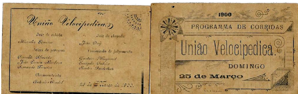
Figura 2: Frente e verso do convite com programação de corridas da União Velocipédica de 25 de março de 1900.

Em 1900 iniciam-se as disputas ciclísticas no âmbito estadual, que passaram a ser realizadas anualmente popularizando o ciclismo em Porto Alegre e em todo Estado (FRANCO, 2000). Havia um grande número de ciclistas tanto na Sociedade Blitz como na União Velocipédica e os eventos eram divulgados através de convites (Imagem 3). O público porto-alegrense comparecia aos velódromos para assistir as competições que tinham um aspecto festivo (REVISTA DO GLOBO, 1936, p. 15 apud MAZO, 2004).