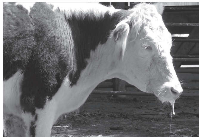
Fig.3. Intoxicação experimental por Nerium oleander . Bovino 2 apresentando sialorréia.

Ao exame microscópico, observou-se necrose de coagulação de fibras cardíacas individuais em pequenos agrupamentos, caracterizada por aumento de eosinofilia citoplasmática e núcleos picnóticos (Fig.2). Essas lesões eram mais acentuadas no músculo papilar (Quadro 2). Algumas áreas apresentavam material proteináceo no interstício e hemorragia subendocárdica. O rúmen apresentava degeneração hidrópica das camadas superficiais do epitélio. No fígado, havia congestão difusa acentuada e, no baço, infiltrado linfocitário nos folículos e hemossiderina no interior de macrófagos.