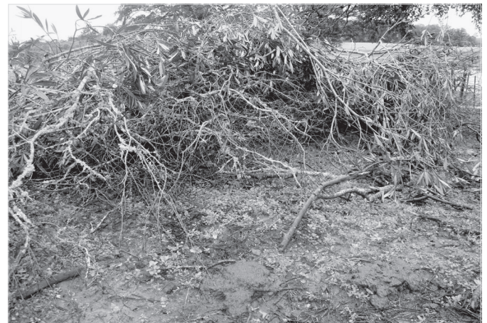
Fig.1. Intoxicação natural por Nerium oleander . Local onde foram colocados os galhos podados. Galhos da planta com sinais de haverem sido consumidos e fezes no entorno, demonstrando o acesso dos bovinos.

Um bezerro mestiço de 4 meses de idade morreu subitamente após consumir folhas dos galhos podados de Nerium oleander e apresentou decúbito lateral, movimentos de pedagem e vocalização. Esse bezerro não foi necropsiado porque havia morrido dois dias antes da visita. Um bovino fêmea com 3 anos de idade, da raça Brahman (Bovino 1) foi encontrada morta ao amanhecer, sem observação prévia de sinais clínicos. Essa vaca foi descrita como dominante e a mais voraz do lote. Havia congestão de mucosas (ocular, bucal, vulvar). Alterações macroscópicas observadas no coração incluíram petéquias e equimoses no átrio esquerdo, coágulos e hemorragias no endocárdio do ventrículo esquerdo, áreas levemente pálidas no septo interventricular e em algumas porções do miocárdio dos ventrículos. Observou-se também espuma na porção final da traquéia e nos brônquios, fígado vermelho-escuro, rins pálidos, avermelhamento da mucosa do retículo e rúmen, onde havia considerável quantidade de folhas de N. oleander e seus fragmentos. Durante a visita à propriedade, constatou-se que um arbusto de N. oleander havia sido podado e seus galhos jogados no potreiro onde os animais eram mantidos. Esses galhos podados apresentavam sinais de haverem sido consumidos. Fezes frescas de bovino foram encontradas nas proximidades dos galhos (Fig.1).