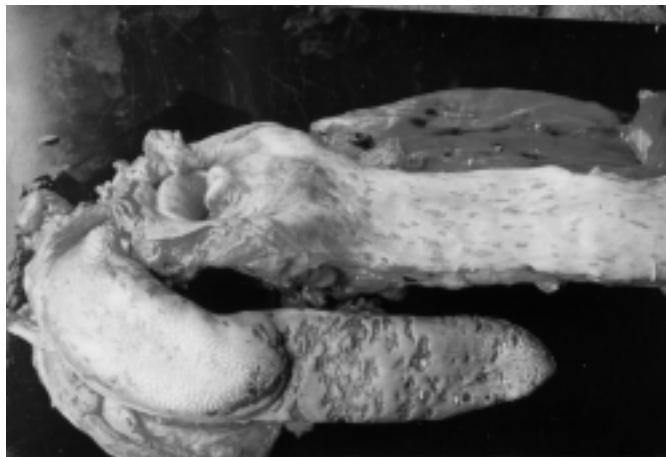
Fig 1. Língua e esôfago do animal caso SV-260. Erosões e ulcerações distribuídas na mucosa digestiva.

O resumo do histórico clínico e dos achados patológicos dos casos SV-260 e LV-96 está apresentado no Quadro 1. Os achados clínico-patológicos mais proeminentes foram enfermidade gastroentérica, erosões e ulcerações orais e no trato digestivo (Figura 1), sinais respiratórios, diarréia, congestão conjuntival e vulvar, e petéquias na vulva. O animal LV-96 pertencia a um rebanho que havia tido casos clínicos compatíveis com BVD, incluindo um caso muito semelhante à Doença das Mucosas. O animal afetado nesse caso era uma bezerra nascida um dia após a novilha LV-96, cujas mães haviam sido inseminadas no mesmo dia. Essa bezerra morreu após uma enfermidade aguda de poucos dias de duração, e os sinais clínicos e lesões macroscópicas eram muito semelhantes aos apresentados pela novilha LV-96. Um mês após, uma vaca abortou no 6-7º mês de gestação, apresentando hipertermia, petéquias e sufusões na vulva e vagina. Diag-