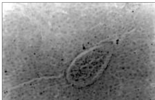
Figura 2 – Aspecto microscópico da congestão vascular em fígado de rato submetido à isquemia hepática durante 45 minutos, seguida de 24 horas de reperfusion. Inúmeros eritrócitos são observados dentro da veia centrolobular (hematoxilina-eosina; aumento de 100X).

No que concerne à origem das EAO na isquemia-reperfusion tecidual, McCord (1985), de maneira simplificada, descreve a rota enzimática da xantina-oxidase: durante a isquemia tecidual, há degradação das reservas celulares de ATP (trifosfato de adenosina), com conseqüente formação de adenosina mono e difosfatada (AMP, ADP), além de inosina e hipoxantina. A depleção energética resulta em falência de vários sistemas de transporte ativo das