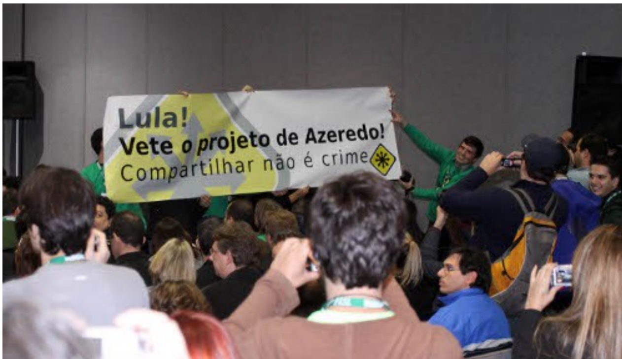
Ilustração 6: Manifestação durante o discurso do Presidente Lula, pedindo o veto ao projeto 84/1999.

Paulo Teixeira (PT-SP), Alessandro Molon (PT-RJ) e Luiza Erundina (PSB-SP), que articularam a oposição ao projeto de cibercrimes e também na defesa pela instauração do Marco Civil da Internet, como instância civil de regulação de direitos na rede.