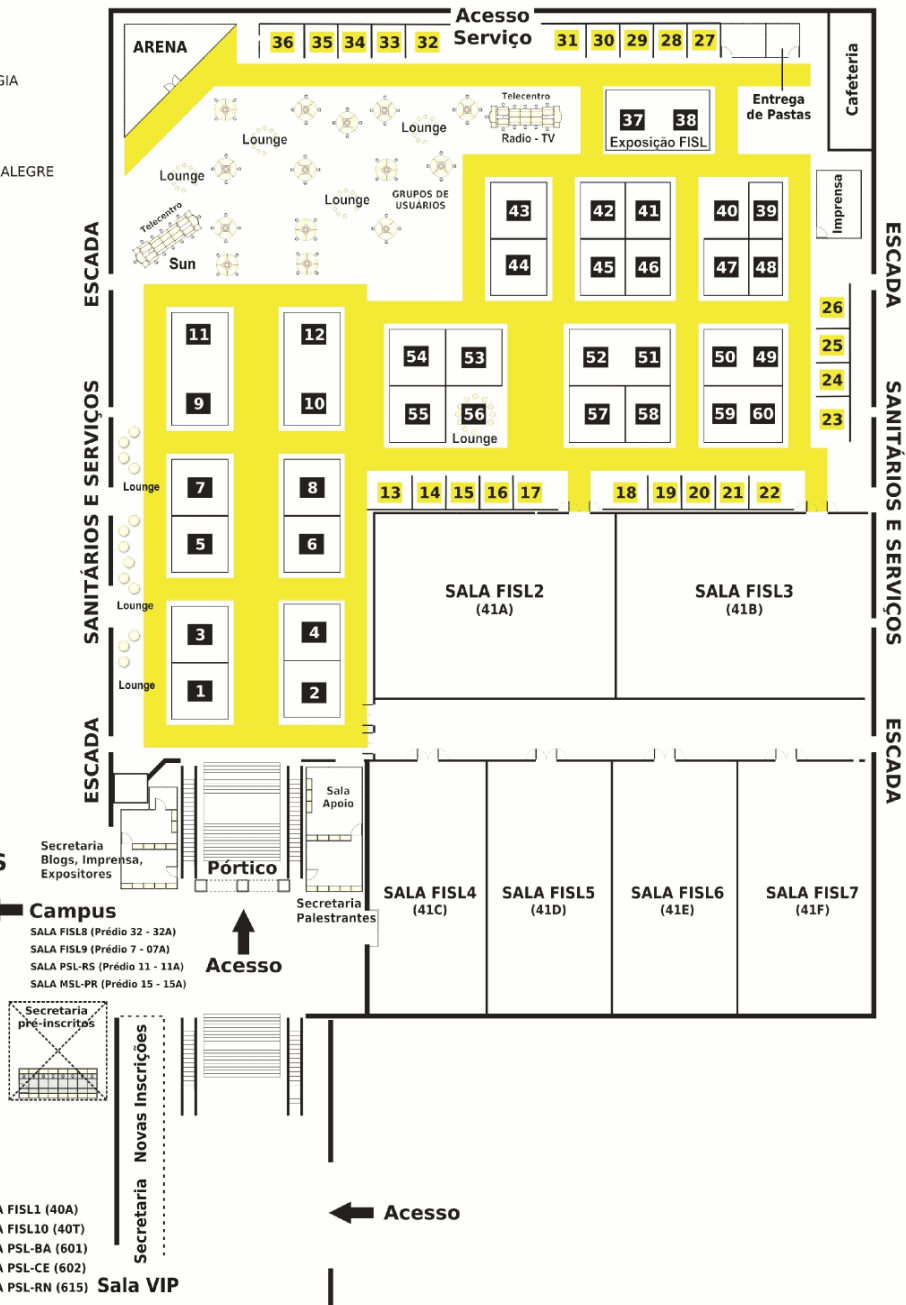
Ilustração 2: Planta baixa do evento. Na parte superior à esquerda, os espaços para os grupos de usuários