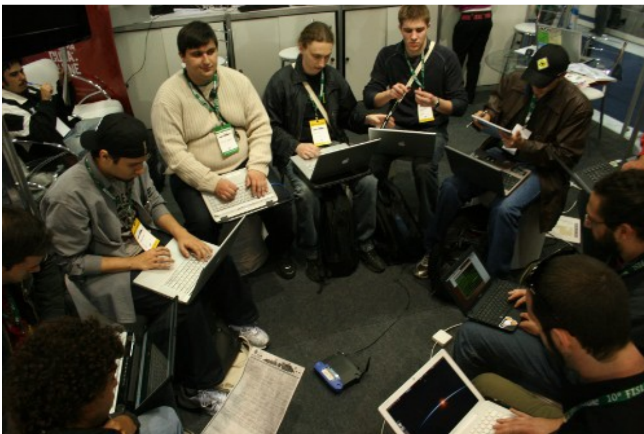
Ilustração 3: Reunião informal típica, no lounge dos Grupos de Usuários

Uma série de signos fornecem um mapa de símbolos que delimitam um amplo leque de filiações: botons , camisetas, mochilas, e principalmente, softwares rodando em cada computador (Ilustração 3). São símbolos que poderiam passar despercebido, mas se tornam fundamentais para interações primárias. Em uma conversa rápida, questões podem vir à tona nos primeiros diálogos: Qual a distribuição GNU/Linux que você usa? Qual editor de texto você prefere? VI ou Emacs? Gnome ou KDE? Python ou Ruby? Todas essas preferências são manifestas em camisetas, insígnias, adesivos colados nos laptops . Se uma possível homogeneidade de um evento de tecnologia sobre algo tão específico é suscitada no início, logo se percebe que há malhas distintas, a qual são investidas diferentes legitimidades.