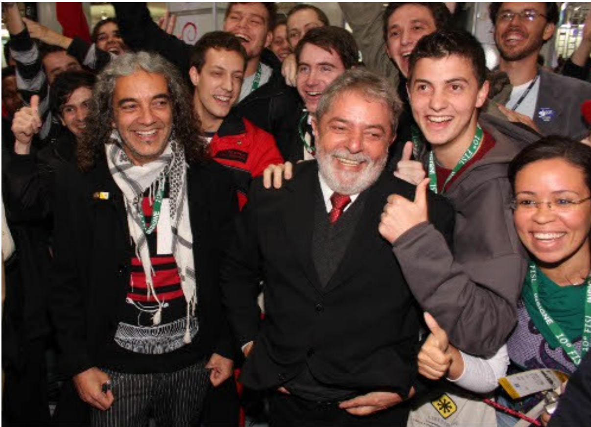
Ilustração 4: Presidente Lula, no momento de caminhada entre os participantes do FISL, no lounge dos Grupos de Usuários

De fato, o discurso que Dilma Rousseff fez foi uma espécie de prestação de contas das ações do Governo Federal na área de software livre. Um pouco enfadonho e direcionado somente para os gestores públicos. O discurso do Presidente, de improviso, ao contrário, atacou diretamente o AI5 Digital: