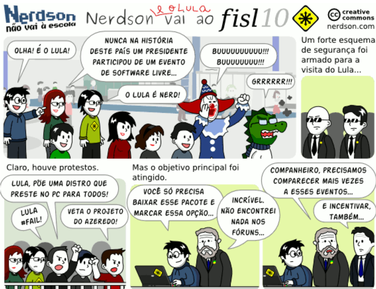
Ilustração 5: Tirinha retrata a polêmica sobre o esquema de segurança montado para receber o Presidente Lula.

A estratégia de colocar o Presidente Lula ao lado de figuras históricas do movimento software livre, como Richard Stallman, John Maddog Hall e Peter Sunde, foi fundamental para alicerçar a ideia de uma vinculação dos objetivos dos atores da cena política com hackers proeminentes e históricos, legitimamente ligados ao meio técnico, a fim de garantir as “liberdades da internet”.