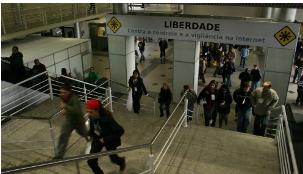
Ilustração 1: Pórtico de entrada do FISL10

Nos dois dias que antecederam o início do evento, entre 22 e 24 de julho, foram erguidos estandes, salas, corredores e mesas para abrigar as mais de 9 mil pessoas que participaram do Fórum Internacional Software Livre. Esses dias de preparação marcam uma mudança substancial na vida dos organizadores. Madrugadas são atravessadas e dezenas de pessoas se aglomeraram nas pequenas dependências da Associação Software Livre.Org (ASL). Nesses dias, hackers , especialistas e voluntários configuraram dezenas de computadores que irão controlar todo o acesso à Internet, o sistema de inscrições, a transmissão do evento, etc. Jornalistas produzem conteúdo para os veículos especializados e para o site do evento. Os responsáveis pela organização da grade de programação confirmaram as presenças, realocaram horários de palestrantes e tentaram, no que parece ser impossível, encaixar as mais de 500 palestras distribuídas em apenas quatro dias. A maior parte das tarefas são realizadas pelo engajamento de voluntários, arregimentados nos meses antecedentes ao evento, em sua grande maioria, já com experiência de ter trabalhado em outros anos no evento.