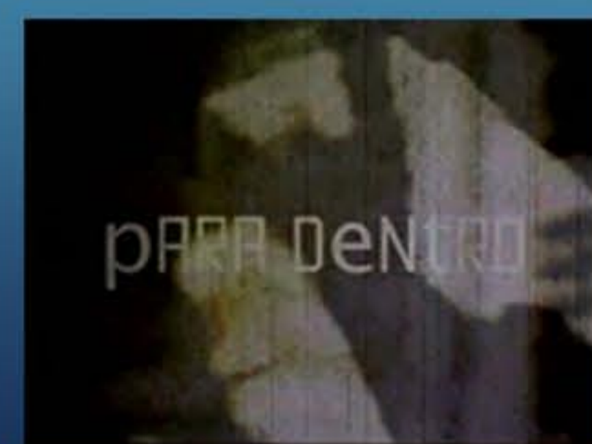
videoarte Para Dentro (2009)