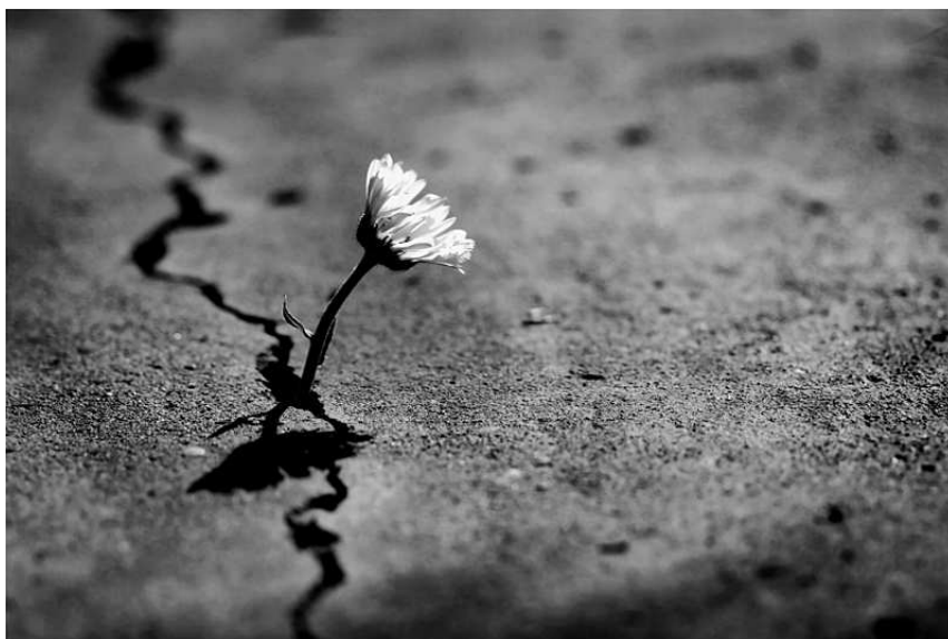
Figura 2 – Flor na fissura vida/asfalto