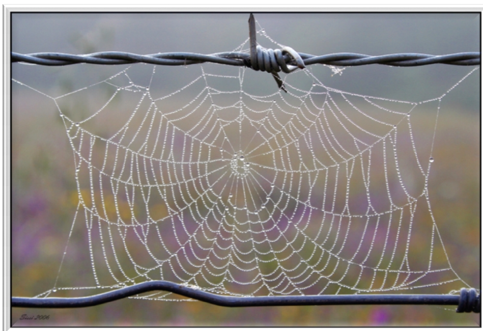
Figura 1 - Teia