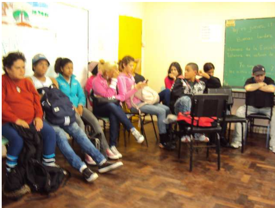
Fotografia 2 - Estudantes em roda de conversa na Terapia Comunitária em 2011