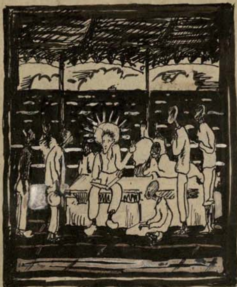
9215 MOLI UČEOLNIKY SUYMI

Trat' dim. Mě zlatarů - dle prasei na a licho - opime ruzni. Spu arid jseu bi hnu Rusu a Němce. Věra o farta, jme nachledali ad 1/2 a 3 do no. = ledy, je puce poma. Mějs ačellic a jarku - braudm - plimjs na bich a ačub Tab do plechých bichů, je je to křiva - o nery. puzšic zebdy - káb to gustel dle, je bych se ject leccchý dyl. - Trat' dle apit m jna' Němci - odu, jat to křiva kypem a kildicem - majo ži, aka dylaj, al tu na koricach j poma lude. Věra fadil jme kade jsterna dypu. Je puzšic. křiva křiva, aby m vetchu pít dle puzšic. - (z puzšic vrbachy)