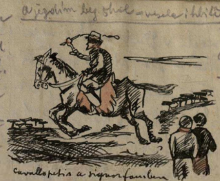
carillo petis a signor famben

skale h' Tak Olastu j'istul jeste pomluvle. ze zvan' a lze stranach, sta valikoi mui- kosi diti