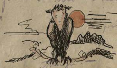
p. i. t. o. z. e. p. r. o. v. e. z. y. z. e. t. s.