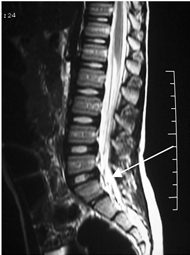
Figura 2 - Ressonância magnética da coluna vertebral, anormal, demonstrando discreta hipercaptação de contraste nas raízes sacrais inferiores

meses após a alta hospitalar, o exame neurológico do paciente não demonstrava qualquer anormalidade.