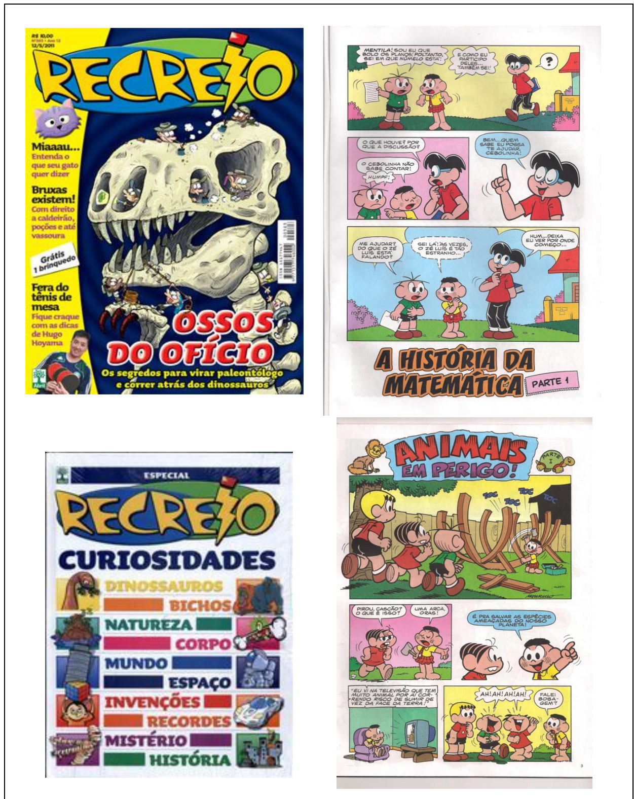
Quadro 6 – Revistas infantis levadas à escola pelos alunos

No caso da Revista Recreio, alguns dos alunos fazem coleção dos encartes especiais e montam livros, como no caso do exemplo acima (levado pela aluna C, 7 anos), que traz curiosidades sobre diversos temas. A Revista Recreio é semanal, portanto, sempre há uma novidade muito atual e instigante e frequentemente, os alunos levam para a escola