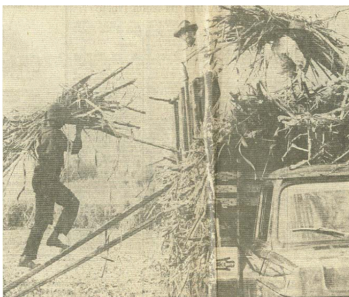
Figura 5: Carregamento manual de cana: momento da subida na prancha.