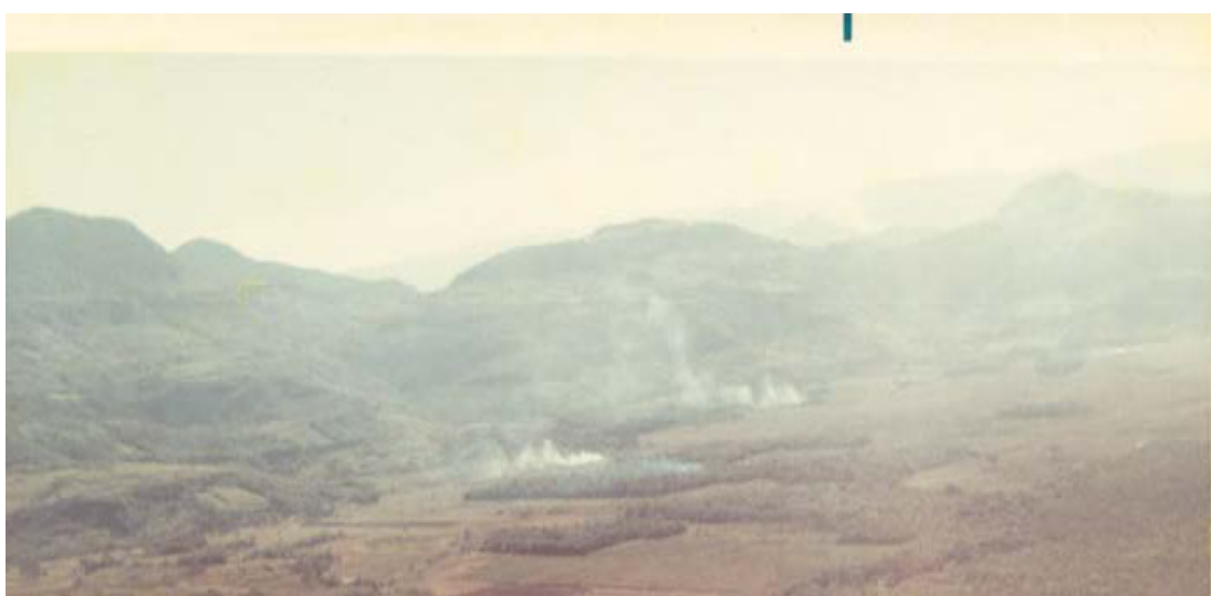
Figura 4: Registro de queimadas para a expansão dos canaviais.