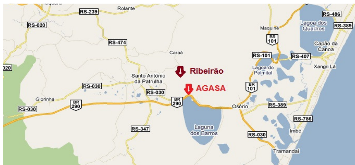
Figura 1: Mapa de localização da AGASA e Ribeirão na região do Litoral Norte do RS.

Santo Antônio da Patrulha é um município localizado no Litoral Norte do Estado do Rio Grande do Sul, distante 76 km da capital do estado que é Porto Alegre. O município de Santo Antônio da Patrulha tem como acessos principais a BR 290 e RS 030. Pela BR 101, através do Município de Osório, tem acesso com o centro do país, já pela RS 474 tem ligação com Rolante, Taquara e a serra gaúcha. O Município possui uma área territorial de 1.049,000 Km 2 , e uma população estimada de 39.910 habitantes (IBGE, 2010).