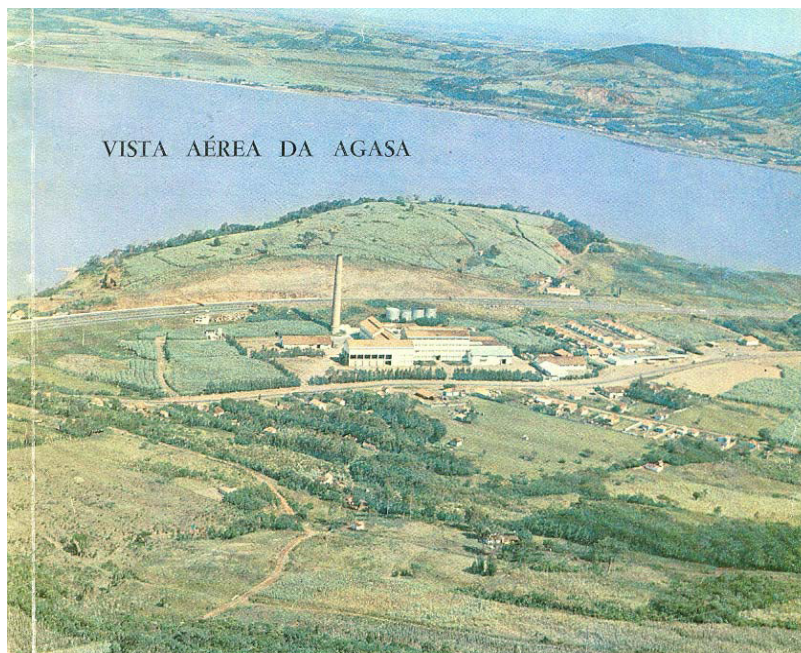
Figura 2: Vista aérea da AGASA

plantação de cana desde o século XVIII, aproveitar esta matéria prima, construindo entre o município de Osório e Santo Antônio da Patrulha, maior produtor de cana na época, a importante usina que alavancaria o progresso da região.