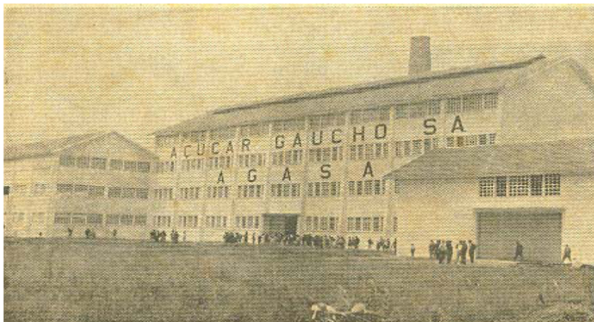
Figura 3: Inauguração da AGASA.

Com a criação da AGASA houve grande euforia dos agricultores da região de Ribeirão, vislumbrando dias melhores para suas famílias.