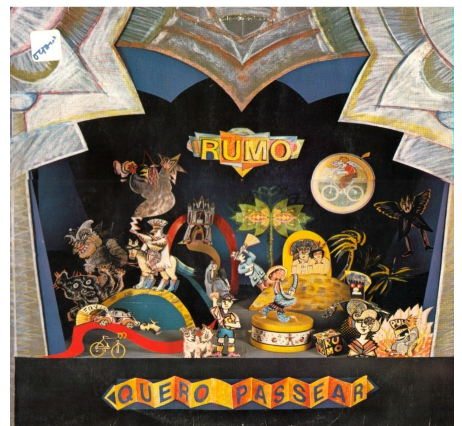
Capa do LP Quero Passear (1988) – GRUPO RUMO Estúdio Eldorado

Se levarmos em consideração que a criança se desenvolve, em grande parte, a partir dos estímulos dados pelas pessoas à sua volta, ou seja, a partir de suas relações sociais, podemos crer que, quanto maior a variedade de estímulos, situados nos mais variados campos de atividades infantis e de forma mais diversa, mais a criança poderá desenvolver seus potenciais (de percepção, sensibilidade, julgamento, crítica e, principalmente, estéticos e musicais) de uma forma também mais rica e ampla.