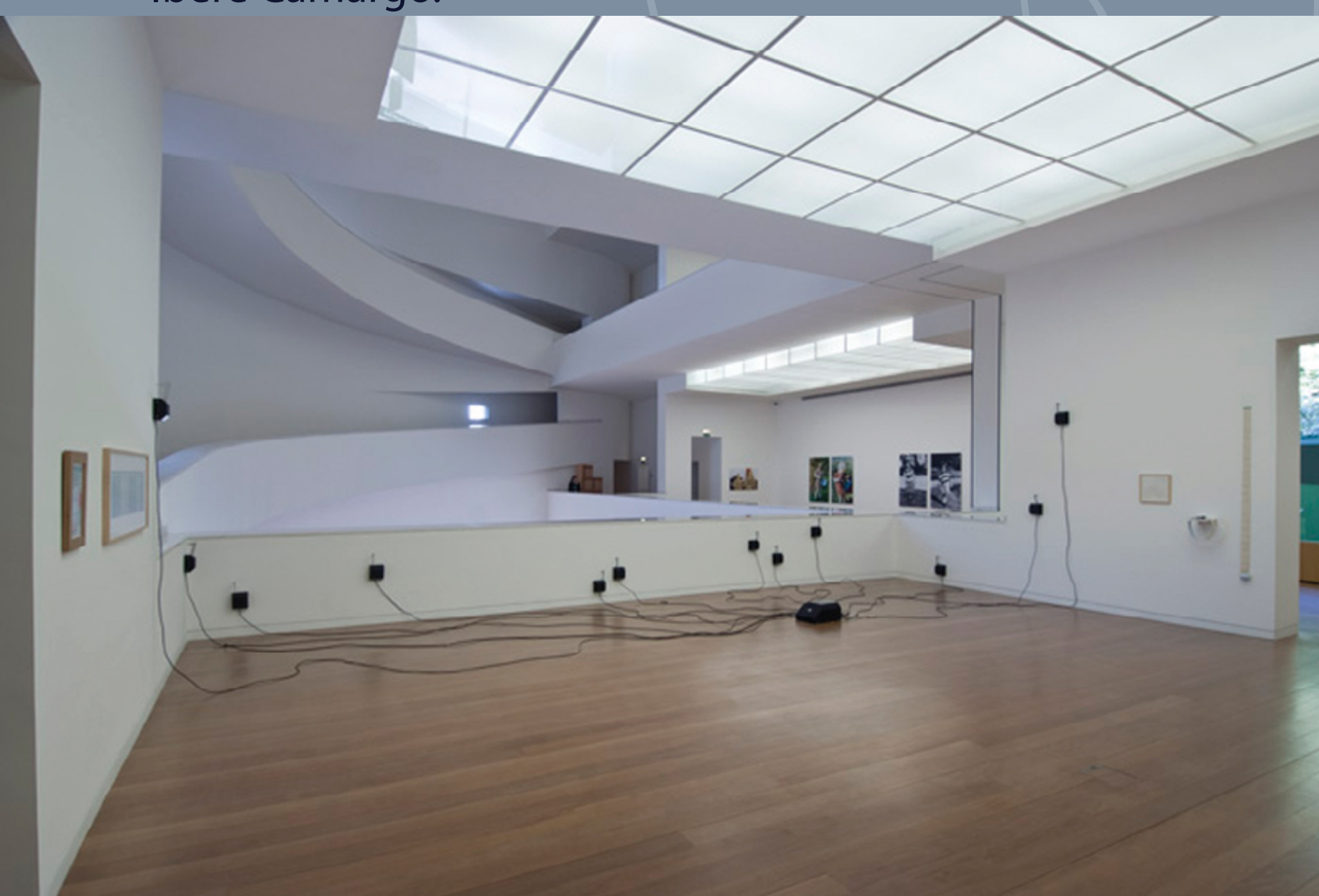
vista da exposição Convivências na Fundação Iberê Camargo