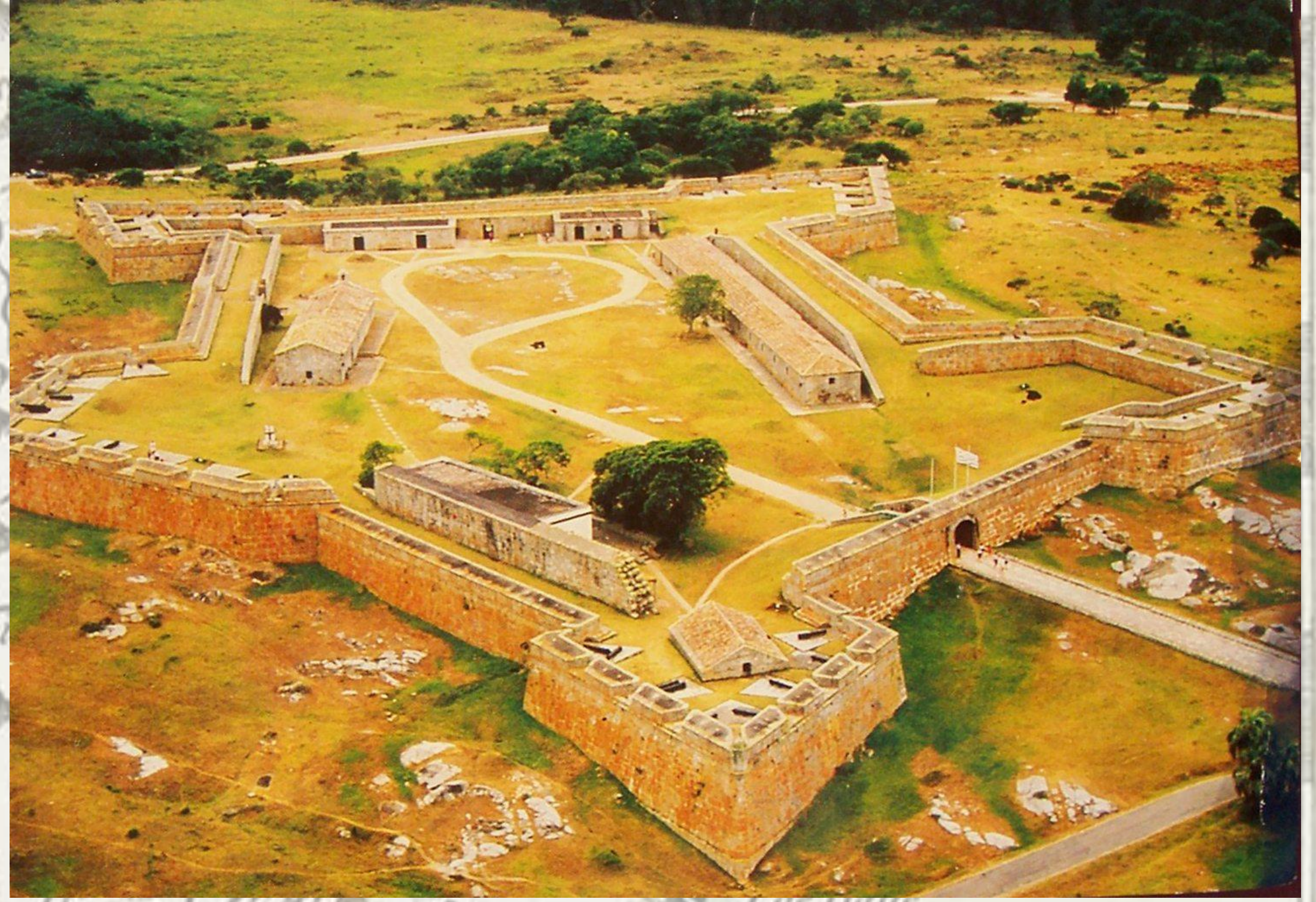
Fortaleza de Santa Teresa, Uruguai: vista aérea.

INTRODUÇÃO: A conquista espanhola do território meridional da América Portuguesa aconteceu a partir do final de outubro de 1762 com a tomada de Colônia do Sacramento por Dom Pedro de Cevallos, governador de Buenos Aires. Na sequência, abril de 1763, ocorreria a tomada do Forte de Santa Teresa, uma das principais defesas do território, seguida pela tomada da Vila de Rio Grande assim como a conquista de boa parte do território da recém criada capitania de Rio Grande de São Pedro. O presente trabalho, que insere-se no projeto intitulado "Governadores da Fronteira: Colônia do Sacramento e Rio Grande de São Pedro (1680-1808)", pretende analisar as medidas tomadas por Inácio Elói Madureira, governador do Rio Grande de São Pedro no período de 1760-1763, assim como as instruções enviadas pela Corte portuguesa ao governador dessa praça e ao Coronel de Dragões Tomás Luís Osorio, comandante da fortaleza de Santa Teresa.