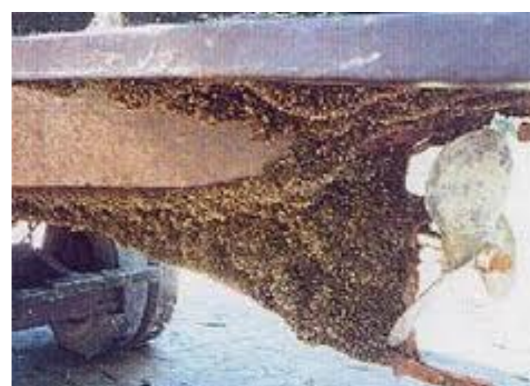
Mexilhão dourado - Limnoperna fortunei