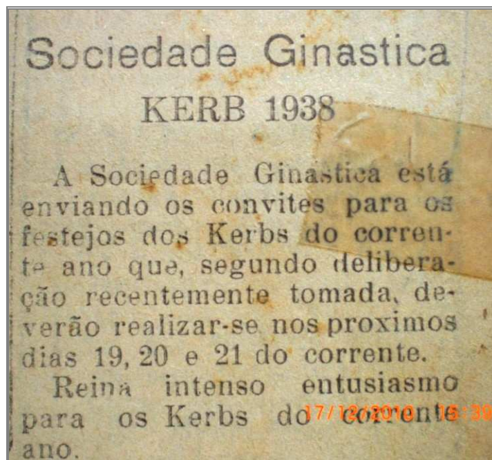
Figura 5 - Anúncio de baile de Kerb em português