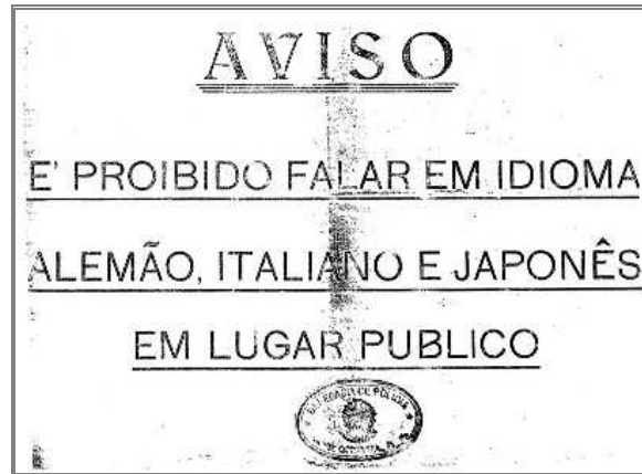
Figura 9 - Cartaz colocados nos muros do município de Estrela proibindo o uso dos idiomas alemão, italiano e japonês

Fonte: Documento cedido por Flávio Jaeger, morador do município