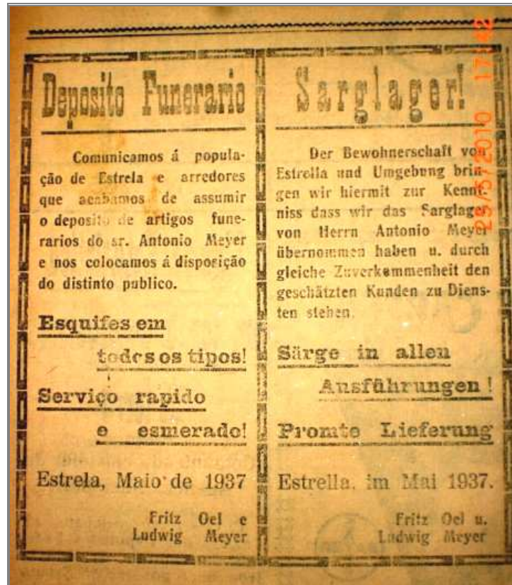
Figura 2 - Comunicado nos idiomas alemão e português em O Paladino

Fonte: O PALADINO, 8 maio 1937, p. 2 (ML) 17