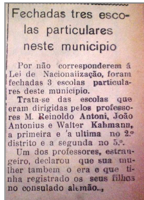
Figura 8 - Fechamento de escolas no município de Estrela em virtude da não correspondências à Lei de Nacionalização

Fonte: O PALADINO, 03 jun. 1939, p. 3, ML