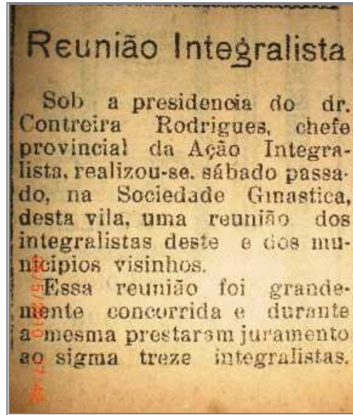
Figura 4 - Anúncio de reunião de integralistas