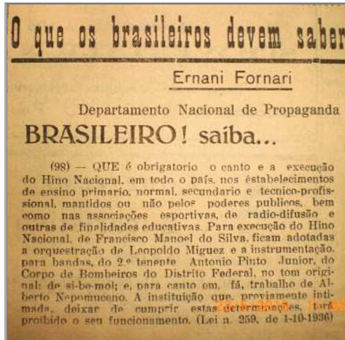
Figura 3 - “O que os brasileiros devem saber”.