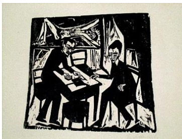
Erich Heckel (1883 - 1970) Zwei Männer am Tisch , 1913

Consequentemente não trabalha tanto com efeitos de iluminação no sentido de criar um mundo de sombras e duplicidade, mas apenas com linhas brancas distorcidas e quase fosforescentes sobre um fundo preto e assim se aproxima bem mais das gravuras expressionistas.