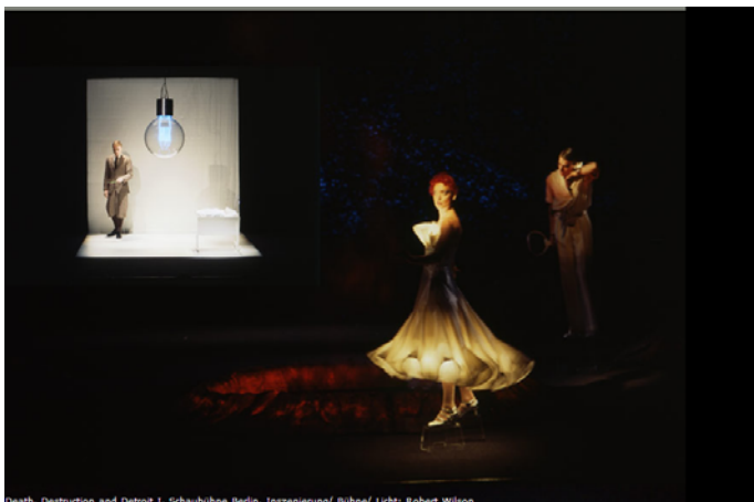
Reith, Destruction and Retreat I , Schauspielhaus Berlin, Inszenierung/ Bühnen/ Licht: Robert Wilson

Este paralelismo de mundos e ambientes encontra sua contra-partida moderna, por exemplo, em Robert Wilson;