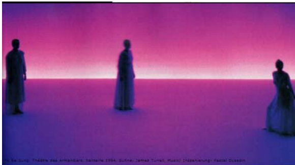
1994- iluminação de James Turrell

O artista James Turrell não apenas faz instalações à base de luz como também insere seus espaços iluminados no âmbito do teatro: