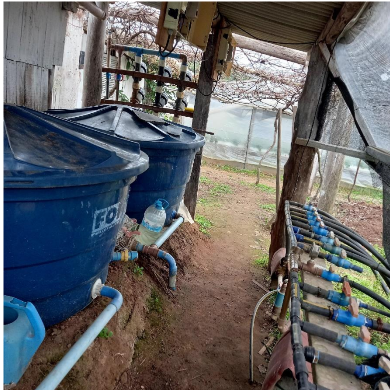
Figura 15 – Caixas d'água onde é filtrada a água