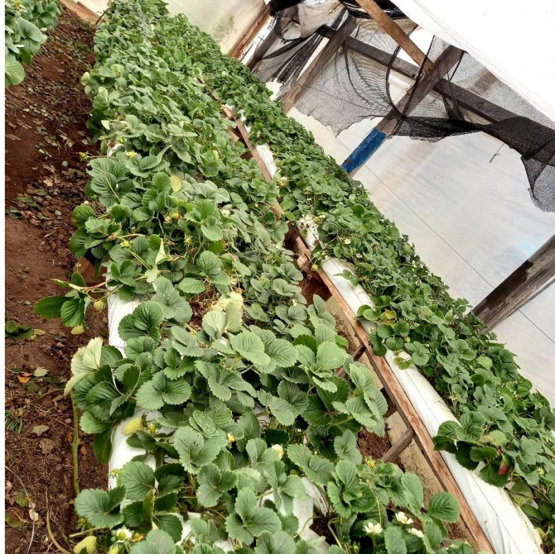
Figura 8 – Canteiro de produção de morangos