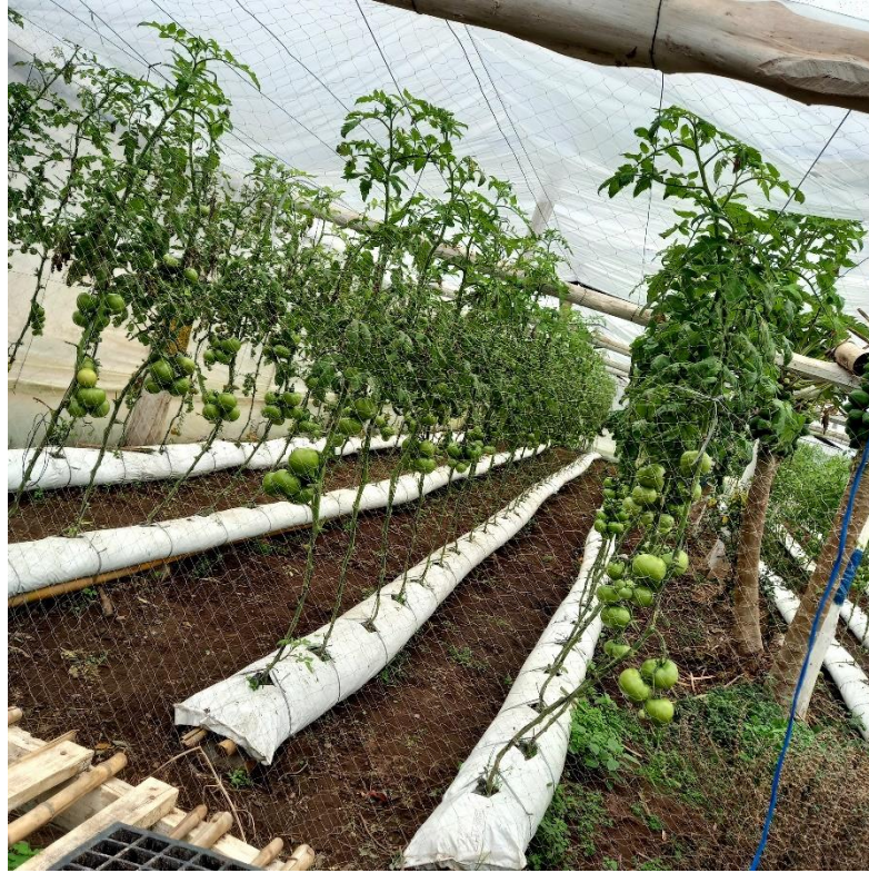
Figura 11 – Técnica de canteiros feito com slabs