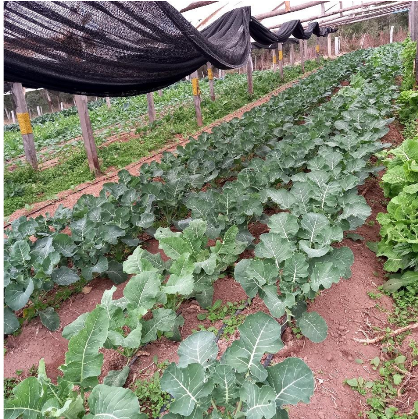
Figura 10 – Canteiro de produção de couve