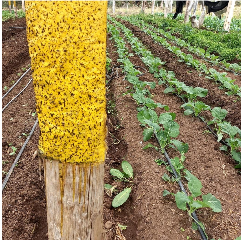
Figura 19 – Adesivo que atrai insetos que voam

Para insetos que voam, seu Miro utiliza uma espécie de adesivo colocado nas colunas entre um canteiro e outro, conforme pode ser visto na figura 19, para cada cor de adesivo, é atraído um tipo de inseto diferente.