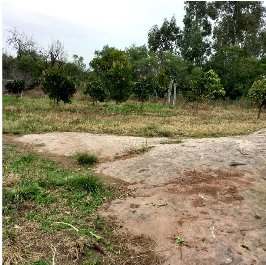
Figura 7 – Presença de rochas no solo da chácara

Contrariando o que todos falaram, seu Miro, após estudar o relevo e o clima local pôde constatar que com mão de obra, serviço e investimento, transformaria as terras onde o arenito prevalece e as rochas são vistas sob a terra e a poucos metros abaixo dela, conforme mostrado na figura 7, em uma grande produção de verduras, hortaliças e frutas, tudo livre do uso de agrotóxicos.