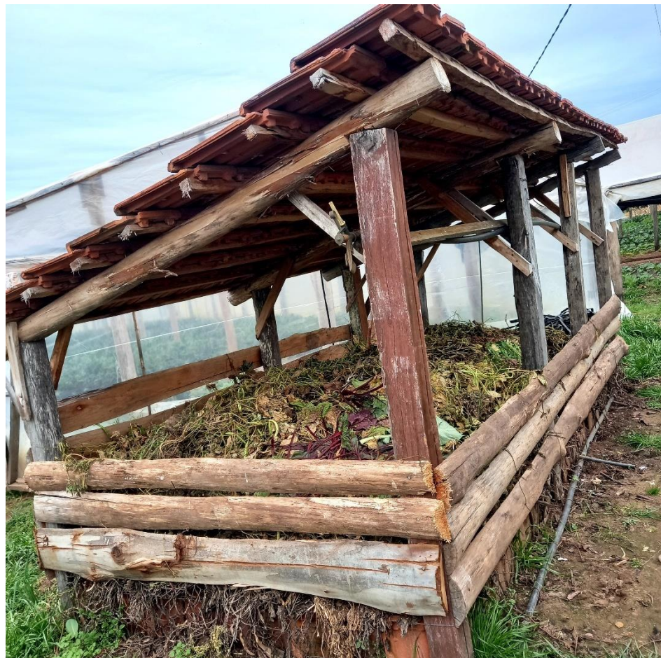
Figura 16 – Local de compostagem com restos orgânicos e minhocas

Na compostagem seu Miro utiliza esterco de cabrito, porco e galinha, além de serragem de eucalipto e restos orgânicos como folhas secas, conforme é mostrado nas figuras 16 e 17.