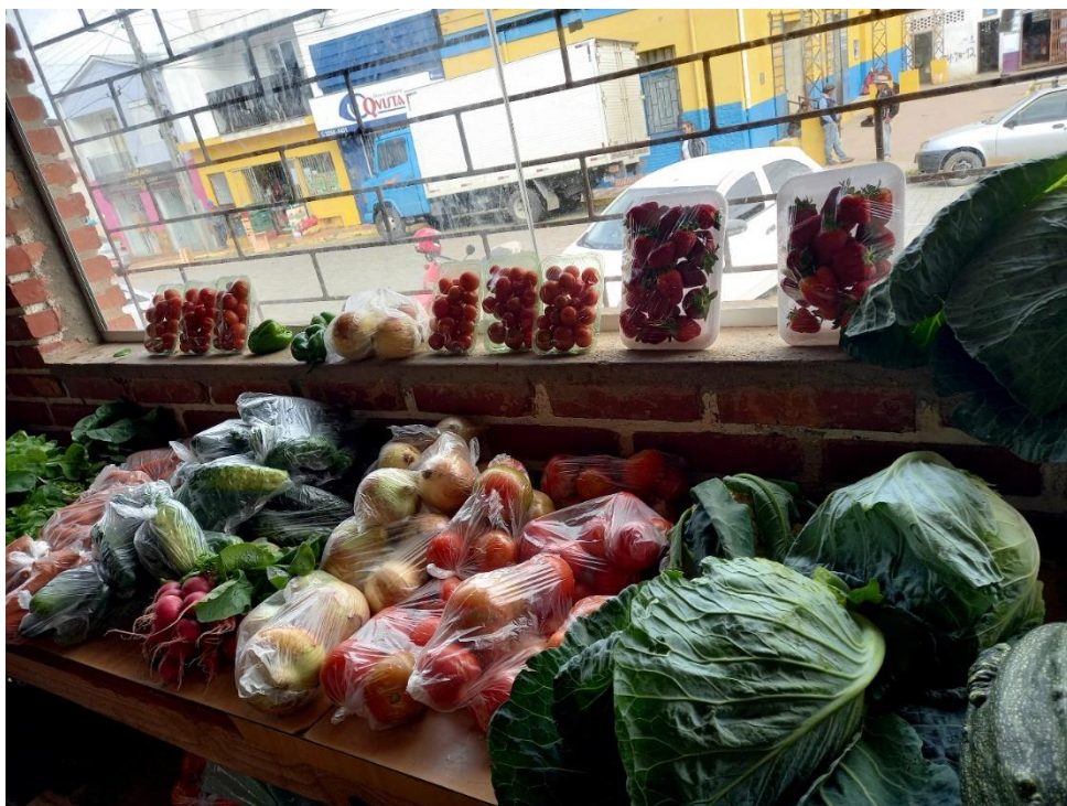
Figura 6 – Alimentos in natura , produzidos de forma orgânica – Banca do Feirante 5

Durante a entrevista, ficou visível a importância dessa ajuda que os filhos dão no seguimento do trabalho iniciado pelo feirante 5 na produção de alimentos, pois eles ofertam uma grande quantidade de produtos in natura , sendo frutas, verduras e legumes variados, conforme pode ser visto na figura 6. No ato da venda quem mais atende os fregueses é a filha do feirante, juntamente com a esposa dele.