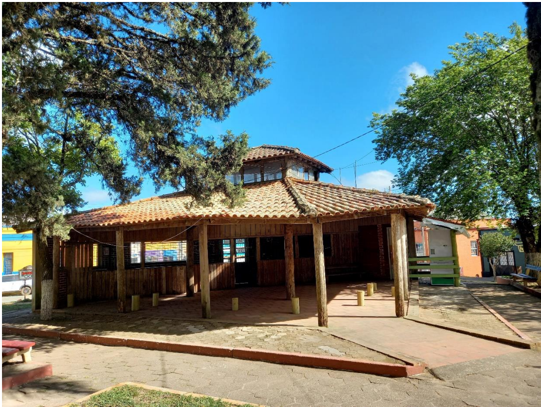
Figura 3 – Quiosque na praça central de Santana da Boa Vista onde se realiza a feira do produtor