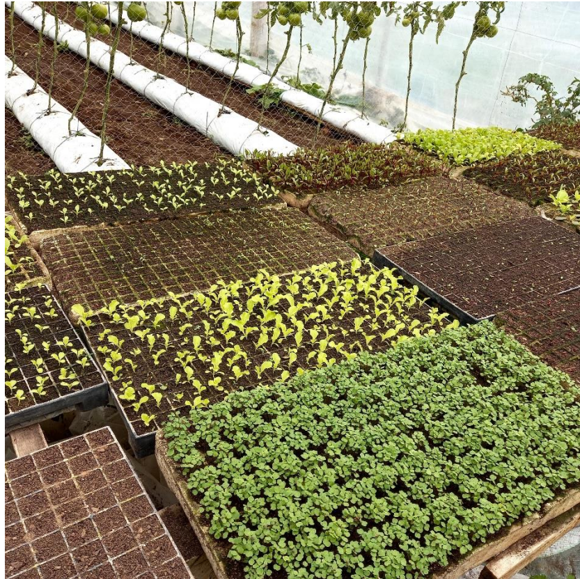
Figura 18 – Bandejas com mudas que recebem o adubo natural para serem replantadas nos canteiros