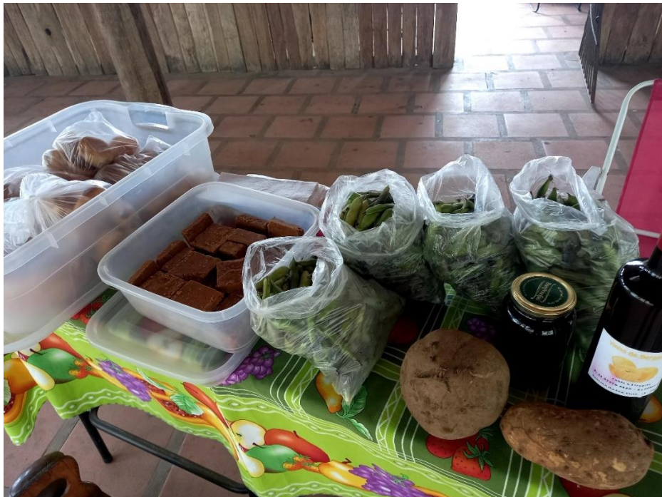
Figura 4 – Alimentos processados e in natura – Banca do Feirante 9

A feirante 9, também relatou que os ingredientes utilizados para a produção de seus alimentos são de produção própria, a mesma também comercializa na feira produtos in natura , como fava e batata doce, conforme mostra a figura 4, além de produtos sazonais, como mel e mandioca.