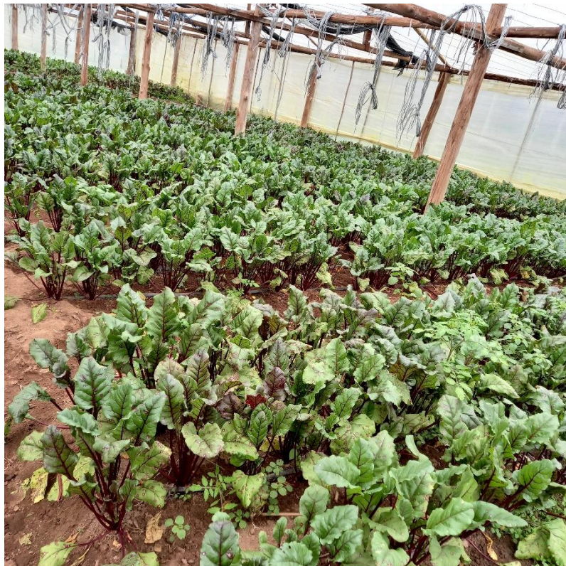
Figura 9 – Canteiro de produção de beterrabas