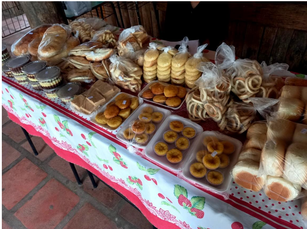
Figura 5 – Alimentos processados – Banca do Feirante 7

Sobre essa contribuição que a feirante 7 traz sobre a valorização do produto in natura na feira do produtor rural, fica também como uma possível resposta sobre a pouca oferta destes produtos na feira, já que durante a semana da entrevista apenas dois produtores ofertavam apenas estes produtos, sem a opção de produtos processados.