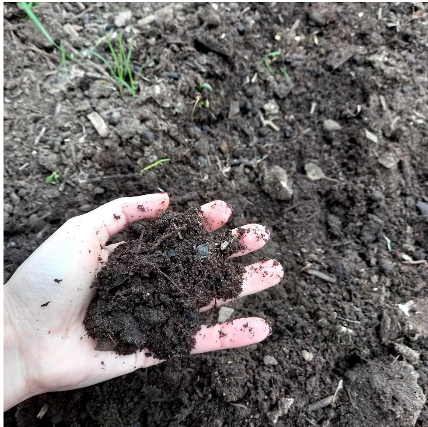
Figura 17 – Adubo natural, terra pronta para ser usada nas plantas