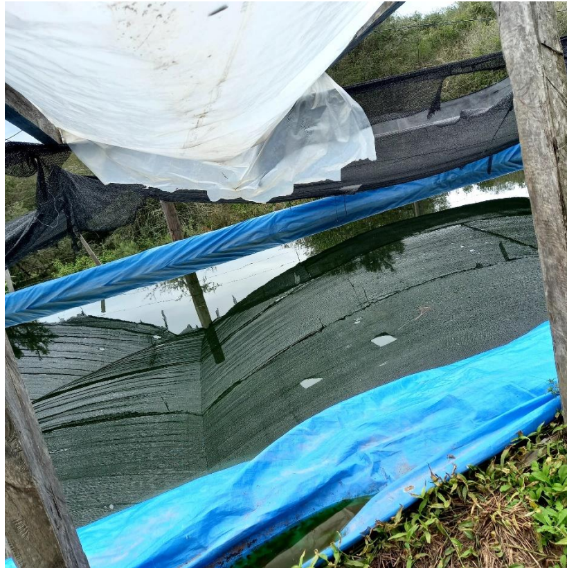
Figura 14 – Cisterna feita por seu Miro e os filhos