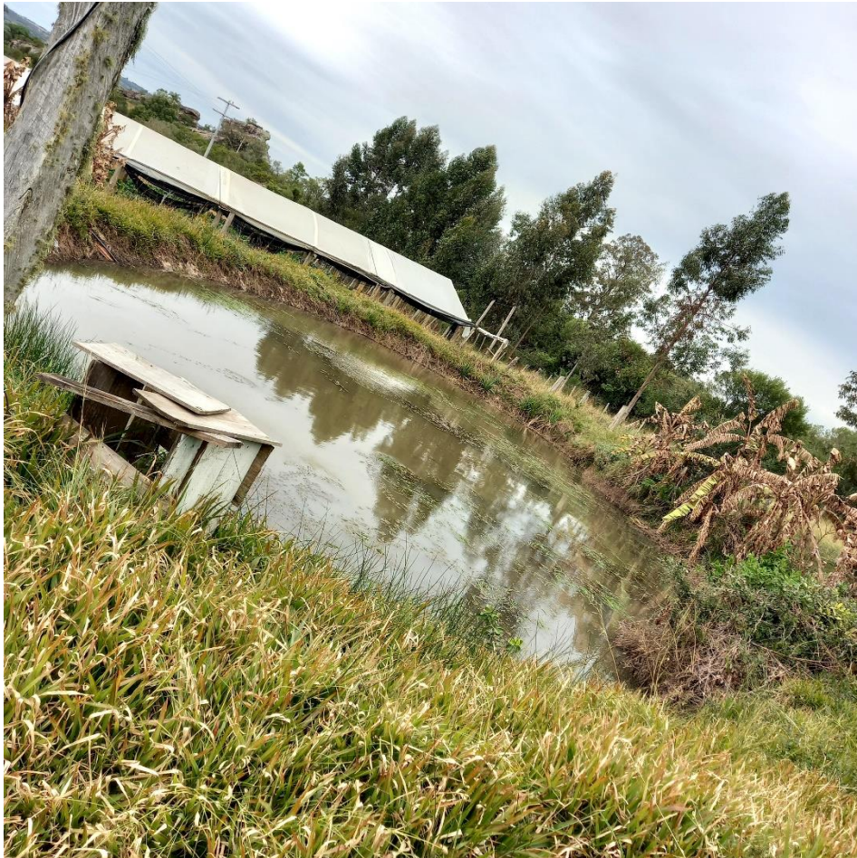
Figura 12 – Um dos quatro açudes da chácara

No início de sua empreitada a maior preocupação que seu Miro tinha era com a irrigação para tornar viável a ideia de sua “horta orgânica”. Para isso, além da busca por informações técnica e observações no relevo, seu Miro constrói seu primeiro açude na chácara, conforme é mostrado na figura 12, hoje a propriedade conta com quatro no total, que segundo o agricultor, lhes garantem uma reserva de aproximadamente 600 mil litros de água, cada.