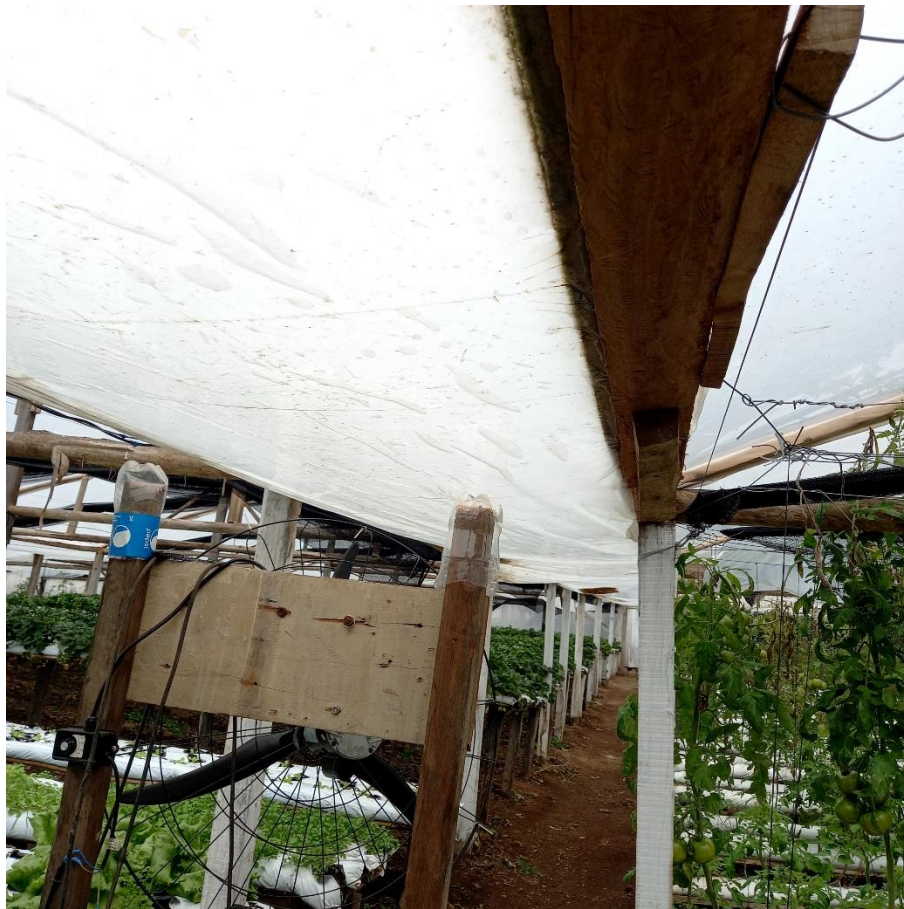
Figura 13 – Calhas feitas entre o encontro de uma estufa e outra

Seu Miro não investiu apenas no feitiço dos açudes, mas também em canalização para todas as estufas e na construção de calhas entre o encontro de uma estufa e outra. Pois ele sabia que a água é o item imprescindível para ser possível a realização de sua prática agrícola. Conforme é mostrado nas figuras seguintes (Figuras 13, 14 e 15).