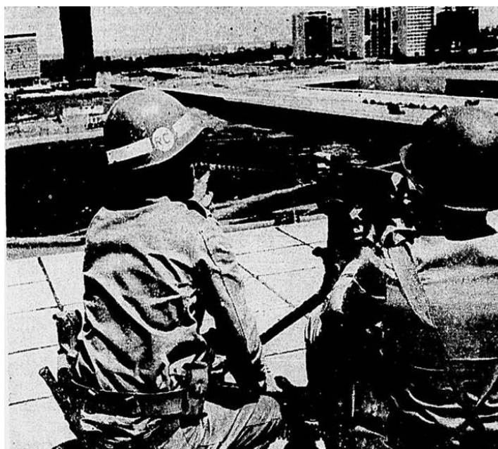
Figura 2 – Imagem publicada na primeira página do 1º caderno de Correio da Manhã , edição de 12.04.1964

Com 361 votos, num total de 438 votantes, o general Humberto de Alencar Castelo Branco elegeu-se ontem, por via indireta, presidente da República dos Estados Unidos do Brasil. Para proteger a eleição, desde ontem que Brasília esteve fortemente policiada. Não houve incidentes nem dentro nem fora do Congresso. A eleição processou-se em paz. O candidato único e vitorioso teve, contra si, apenas 77 votos. Destes, 72 foram abstenções. O marechal Dutra conseguiu dois votos, apesar de ter retirado a sua candidatura. E outro marechal, o sr. Juarez Távora, que nem chegou a ser candidato, teve 3 votos. A metralhadora da foto foi inútil: serviu apenas de moldura. 50