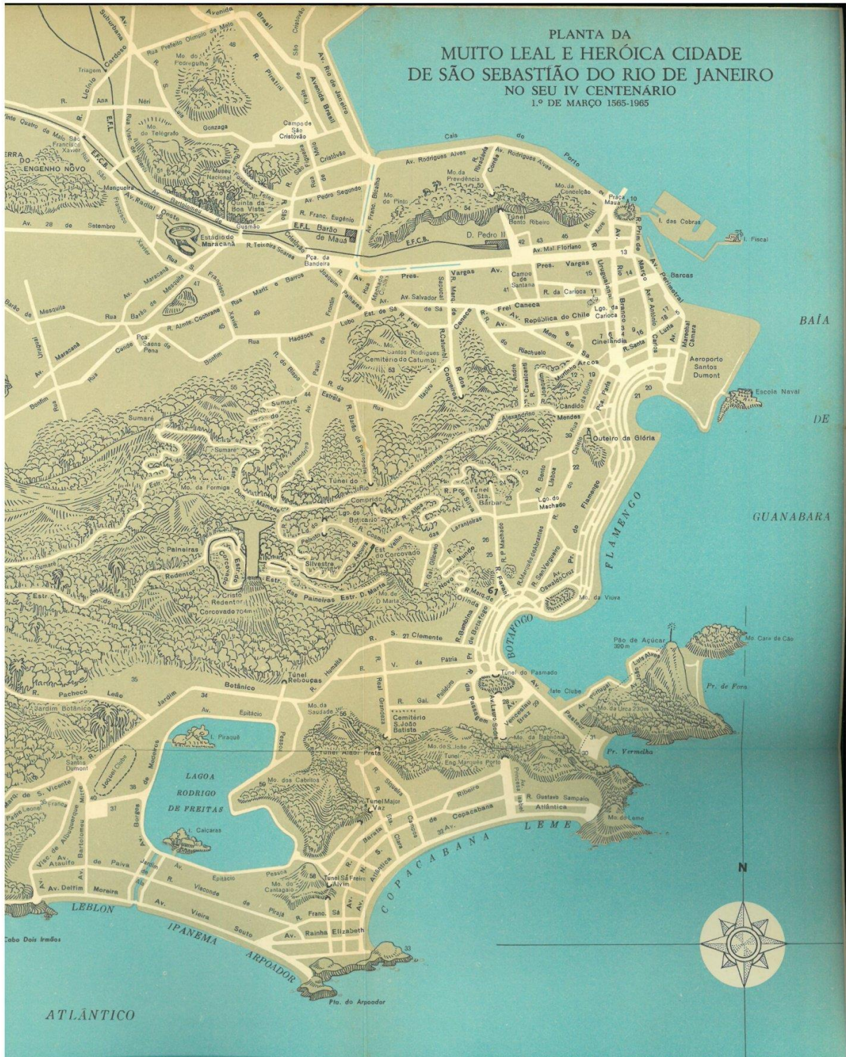
Mapa 1 – Organizado e desenhado por Eduardo Canabrava Barreiros (1964).

Abaixo, estão os mapas citados na seção 3.