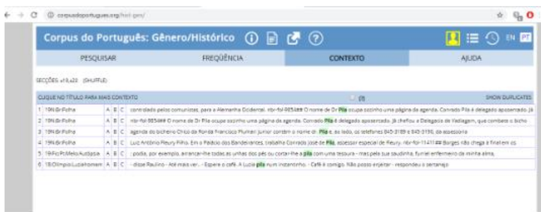
Figura 5- Corpus do Português.

O Corpus Brasileiro 16 que é composto por um bilhão de palavras de português brasileiro contemporâneo, de vários tipos de linguagem. O projeto Corpus Brasileiro, do grupo GELC, que está sediado no Centro de Pesquisas, Recursos e Informação de Linguagem (CEPRIL), Programa de Pós-Graduação em Linguística Aplicada (LAEL) da PUCSP, com apoio da FAPESP. O usuário terá acesso a informações sobre frequência de ocorrência dos termos de sua busca, além de linhas de concordância onde os termos ocorrem. Foi desenvolvido por Berber Sardinha e está disponível gratuitamente. Neste corpus não foram encontradas ocorrências da palavra pila como referência a dinheiro, conforme pode ser ilustrado na Figura 5 a seguir.