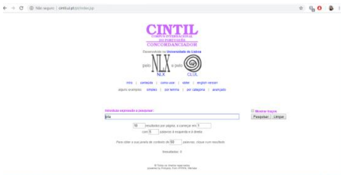
Figura 7- Corpus CINTIL

Na tabela 2 podemos observar quais dicionários foram consultados, analisar as diferentes definições encontradas e quais os anos de ocorrência da palavra.