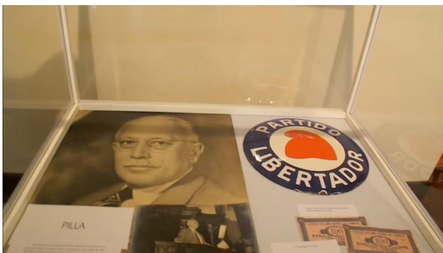
Figura 2

Segundo um material vinculado à exposição "Vale um pila" no Museu Júlio de Castilhos em 2014 3 , a moeda circulou no Rio Grande do Sul e principalmente em Porto Alegre, ficou popularizada como 'pila'. Essa exposição também continha imagens da moeda que circulou durante a revolução de 32. A assinatura de Raul Pilla ficava no canto inferior esquerdo, como podemos ver na imagem das Figuras 2 e 3 a seguir.