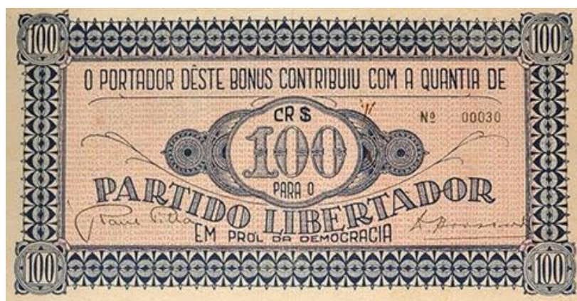
Figura 3- Fonte: cédula digitalizada no blog do Centro de Memória e Informação – CEMIP, doada para a exposição no Museu Júlio de Castilhos pelo colecionador Roberto Prym, diretor do museu na época.

Uma evidência de que o termo “pila” é comum, atual e se associa à cultura gaúcha pode ser visto em um letreiro publicitário de um restaurante localizado em Porto Alegre, no Barra Shopping Sul, “Bah, restaurante gourmet”. O anúncio utiliza uma expressão típica regional e emprega o verbo no imperativo de segunda pessoa do singular ( Te aproxima e entra ). O restaurante elegante ( tem pompa ) e com certo estilo gaúcho (amorosa cozinha do RS), utiliza o termo “pila” para dizer que os seus preços são modestos, apesar da boa qualidade dos pratos oferecidos.