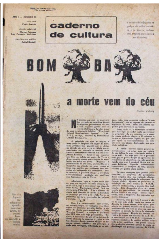
Figuras 1 e 2: capas das edições do Caderno de Cultura de ZH em 16.09.1967 e 09.12.1967