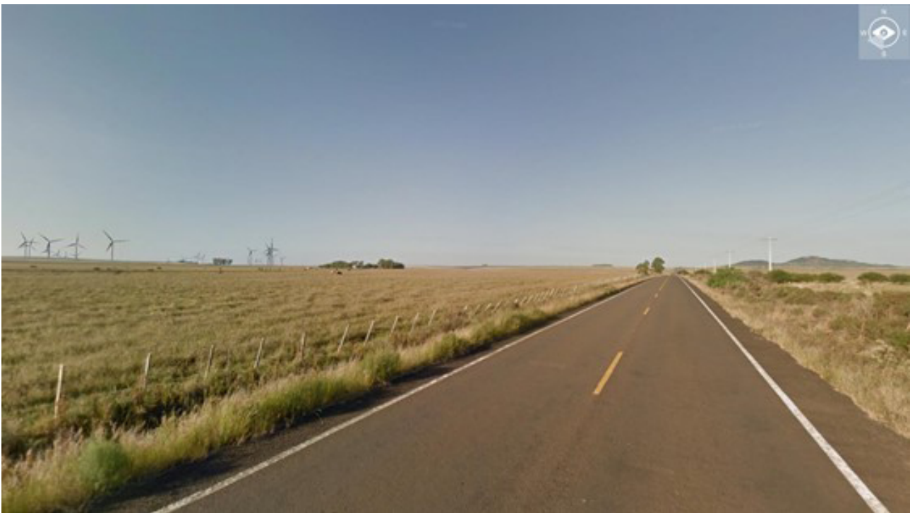
Figura 4 – Exemplo de simulação, onde o Cerro do Jarau aparece à direita da RS-377, considerando um observador que transita no sentido NE-SW

Considerando que o Cerro do Jarau é mencionado na Portaria FEPAM nº 118/2014 como local impróprio para licenciamento de empreendimentos eólicos e que há o interesse na conservação do mesmo, pois tramita de um processo de criação de Unidade de Conservação no local, no presente estudo de caso busca-se apresentar os procedimentos e critérios técnicos que vêm sendo utilizados para evitar o impacto negativo na paisagem, diante da proposição de empreendimento eólico limdeiro a paisagens de máxima relevância para o povo gaúcho. Para assegurar que o empreendimento eólico não seja mais proeminente que o Cerro do Jarau, se propôs a distância de 5 km do ponto culminante da elevação como critério para afastamento, a partir do qual as estruturas poderiam ser posicionadas. A Figura 4 representa uma simulação realizada para a área em questão, com o layout dos aerogeradores dispostos a uma distância de 5 km do Cerro do Jarau.