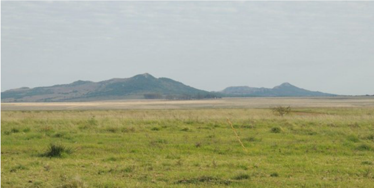
Figura 3 – Vista para o Cerro do Jarau desde a área proposta para o empreendimento