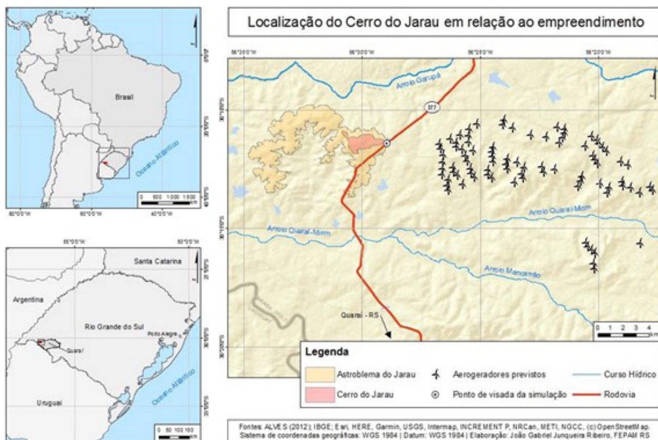
Figura 2 – Mapa de localização do Cerro do Jarau, com destaque ao empreendimento a ser licenciado

A Figura 2 ilustra a localização do cerro, no contexto regional, destacando-se a rede rodoviária e hidrográfica, assim como a sua localização em zona de fronteira Brasil – Uruguai: