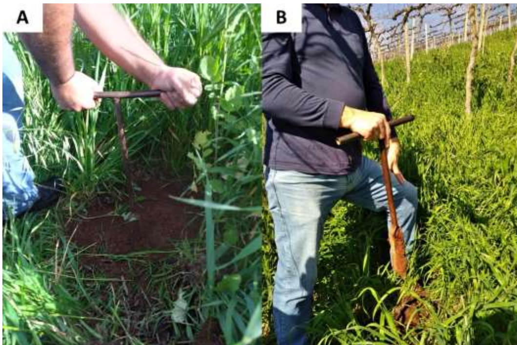
Figura 2 – Coleta de solos com trado holandês em área de cultivo de grãos em Guabiju (A) e em frutíferas em São Jorge (B).

Para compor cada amostra foram coletadas cerca de 20 subamostras nas culturas de grão e 10 subamostras para as frutíferas, a partir do caminhar aleatório em zig-zag. A vegetação presente na superfície do solo era removida para depois realizar a coleta. Para isso foi utilizado um amostrador de solo do tipo trado holandês (Figura 2). A camada amostrada foi de 0 a 20 cm. As subamostras que compunham a mesma amostra eram misturadas e homogeneizadas dentro de um balde limpo e, posteriormente, cerca de 500 g de solo era acondicionado em uma embalagem plástica identificada.