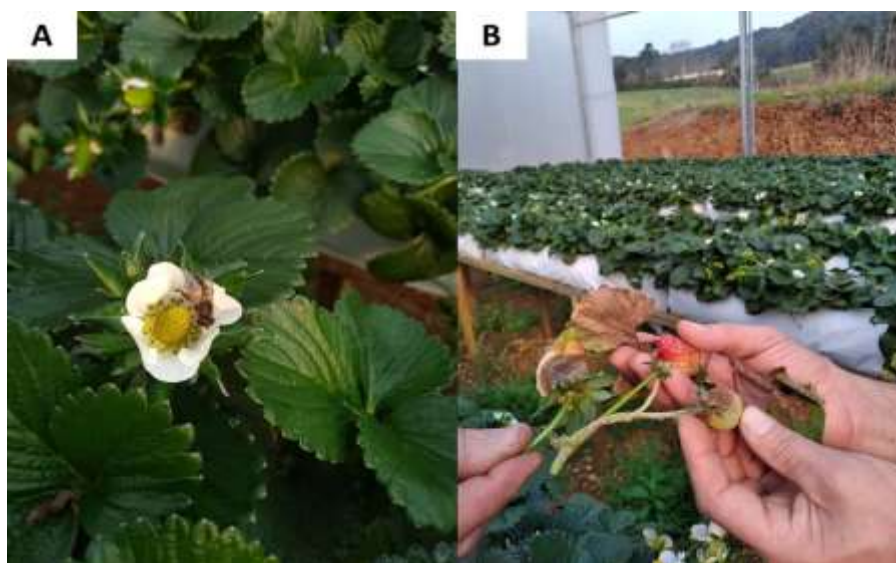
Figura 5 – Presença de abelhas dentro do ambiente protegido (A) e frutos com danos causados pelo mofo cinzento, Botrytis cinerea (B).

Na visita realizada em uma estufa voltada para o cultivo de morangos, foi verificado o crescimento e desenvolvimento das plantas. Foi observado o desenvolvimento dos frutos, não tendo sido identificada nenhuma anormalidade no formato, devido à polinização eficiente, realizada principalmente por abelhas (Figura 5). Por outro lado, foram identificados os primeiros sintomas de doença causada por fungo no cultivo de morangos, identificada como mofo cinzento, Botrytis cinerea (Figura 5). Foi recomendada a retirada de todos os ramos infectados da estufa, como forma de controle e para evitar a contaminação de outras plantas. Posteriormente seriam buscadas alternativas disponíveis no mercado para o controle da doença.