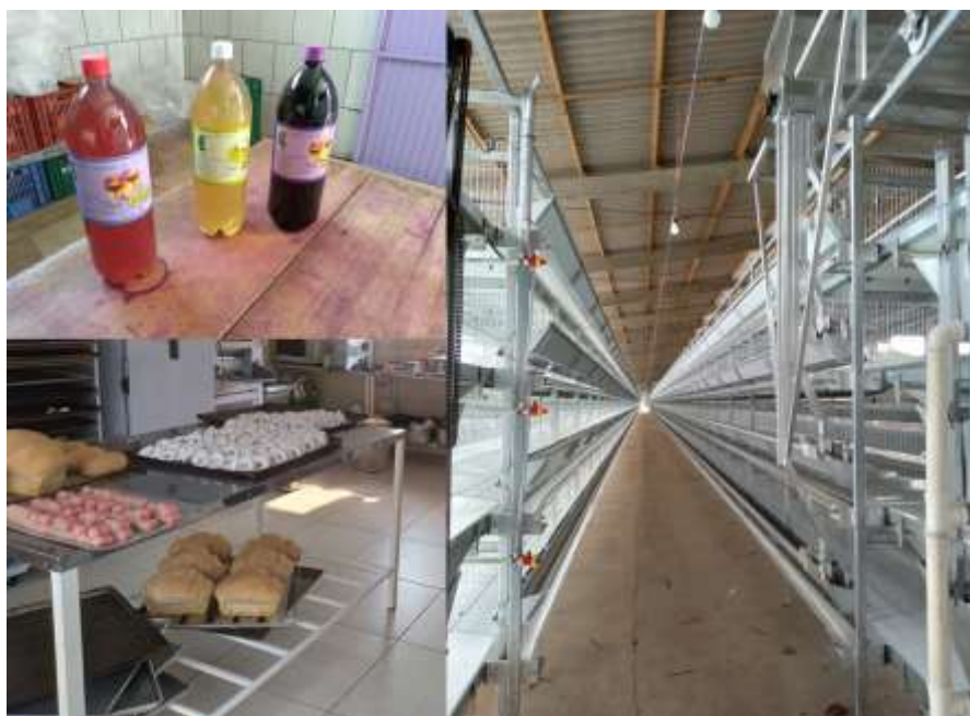
Figura 7 – Os vinhos fabricados no município de São Jorge (à esquerda superior), os produtos da agroindústria de panificação (à esquerda inferior) e as instalações do aviário de poedeiras (à direita).

O município de São Jorge possui diversas agroindústrias familiares, como mostra a Figura 7, algumas são voltadas para a produção de pães, massas, biscoitos, doces e que atendem o Programa Nacional da Alimentação Escolar (PNAE) nas escolas do município. Outras realizam o processamento e beneficiamento de uvas viníferas para a fabricação de vinhos tintos, rosé e branco (Figura 7) que são vendidos em comércios locais e em municípios vizinhos. O município também possui agroindústrias para produção de ovos, onde mais um agricultor iniciou essa atividade no ano de 2021, foi realizada uma visita no local de construção desse novo empreendimento onde serão alojadas 10.000 poedeiras e todo o manejo do aviário será automatizado, as instalações podem ser observadas na Figura 7.