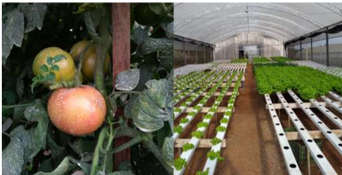
Figura 6 – Desenvolvimento das hortaliças cultivadas em ambiente protegido.

Outra visita foi em uma propriedade que cultiva olericulturas em ambiente protegido, principalmente pimentão e tomate, com cultivo no solo; e alface, chicória, salsa e cebolinha verde em sistema hidropônico. O foco foi verificar a sanidade das culturas, por demanda da agricultora que estava receosa com a possibilidade do ataque de pragas e doenças nas culturas principalmente no tomateiro, pois as aplicações realizadas na cultura envolviam apenas adubos foliares associados a leite cru de vaca e a estrutura do ambiente protegido não conta com armadilhas para o monitoramento de pragas. O engenheiro agrônomo da EMATER, verificou os cultivos, mas nenhuma praga ou doença foi constatada e o desenvolvimento das culturas estavam de acordo com a época de plantio (Figura 6).