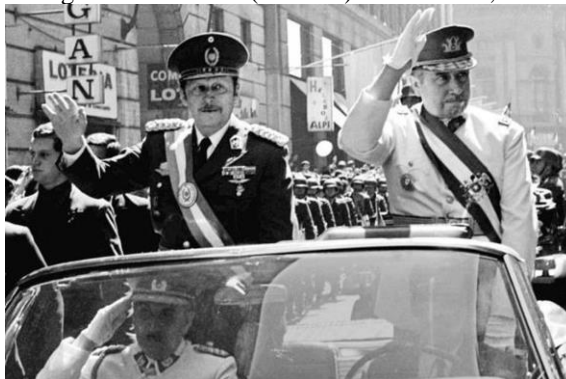
Imagem 3 - Pinochet (à direita) e Stroessner, 1974.

Observa-se, assim, desde o início, a relevância da diligência chilena para conformar diferentes lideranças e autoridades em prol de um mesmo objetivo. O documento assinado 23 nessa reunião foi encontrado entre os Arquivos do Terror do Paraguai, descobertos em 1992, na cidade de Lambaré. No ano anterior ao encontro, em 1974, o ditador chileno Augusto Pinochet visitou o também ditador paraguaio, Alfredo Stroessner, visando uma aproximação com os governos vizinhos, após ter consolidado o golpe (CALLONI, 2016).