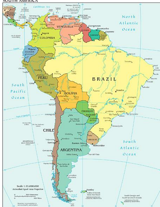
Imagem 1 - Mapa político países da América do Sul

A presente monografia abordou a Operação Condor (OC) utilizando a metodologia de estudo de casos. A OC, estabelecida em 1975, foi um sistema secreto de inteligência e operação, no qual os países partícipes (Chile, Argentina, Paraguai, Uruguai, Bolívia e Brasil) compartilhavam informações e podiam praticar suas operações em território estrangeiro, com o propósito de perseguir dissidentes políticos. A violência, nesse contexto, adquiriu novos contornos, visto que era tanto institucionalizada, na medida em que os militares se apoderaram do Estado, como paralela à legalidade, uma vez que foram estabelecidos aparatos de violência clandestinos, paramilitares, como centros de tortura e de inteligência contrainsurgente (MCSHERRY, 2005). Visando compreender o cenário político-ideológico que propiciou um ambiente local e regional favorável ao empreendimento de uma operação como essa, foram selecionados dois países, Brasil e Chile, para compor os estudos de caso aqui realizados.