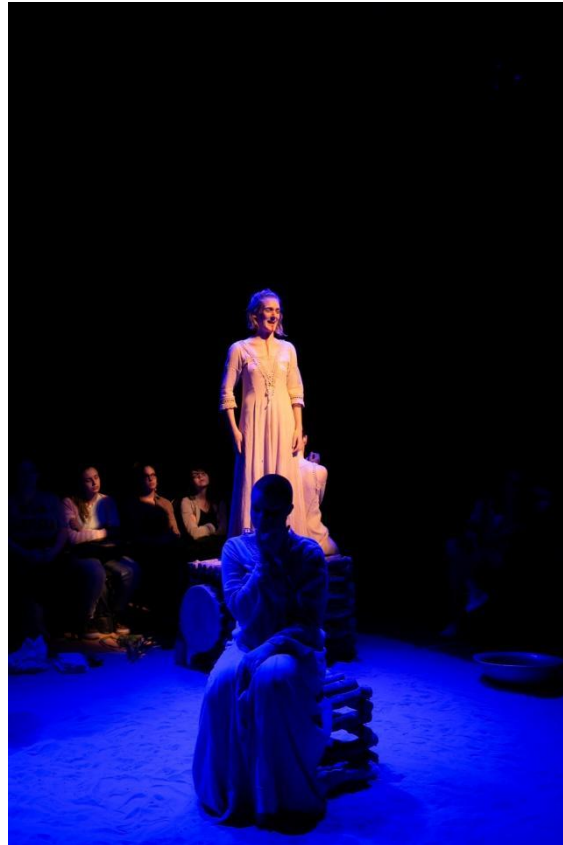
Figura 15: Alunas-atrizes em cena no espetáculo Filhas do Sal. 2019

sombras naturais contribuindo para a ambientalização da ilha em que se passa a narrativa. O espetáculo possui uma luz ágil e assertiva que influencia em seu ritmo.