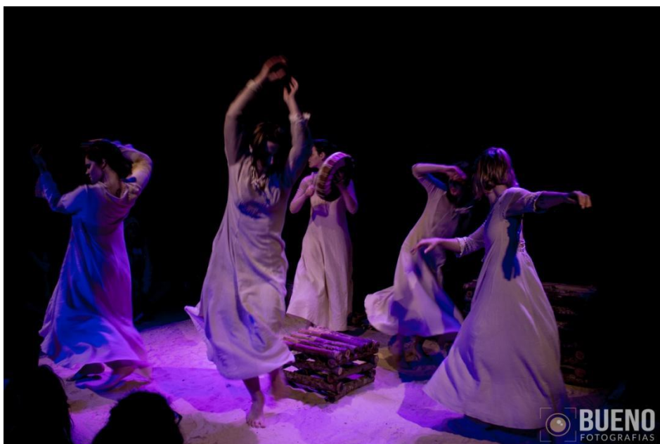
Figura 13: Alunas-atrizes em cena no espetáculo Filhas do Sal. 2019.

Uma das principais características da encenação do espetáculo Filhas do Sal é a relação intimista entre o público e a cena. Em um palco em formato de arena, a peça se desenvolve com o público muito próximo do elenco, tornando-o, assim, cúmplice das ações. Todas as atrizes permanecem em cena desde o início até o fim do espetáculo, sendo que o que delimita as contracenações são os níveis corporais das atrizes, sendo alto e médio para cenas e ações principais e baixo para ações secundárias. Outra grande característica da montagem é o caráter ritualístico que o espetáculo evoca, e isso se edifica através do uso dos elementos técnicos: canções originais são entoadas pelas atrizes, movimentos ancestrais contribuem para as cenas de maior intensidade corporal e a luz, o cenário, a maquiagem e o figurino se complementam, desenhando o ambiente necessário proposto pela dramaturgia.