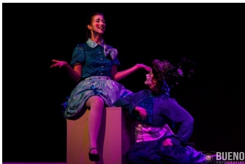
Figura 12: Alunas-atrizes do grupo Pegamôt em cena no espetáculo “Diário Inexistente”. (Foto: Acervo ACEFH - outubro de 2019).

O terceiro grupo/turma era o “ Foi O Que Eu Disse ”. Esse era o grupo mais avançado da associação, era composto por cinco mulheres adultas que já faziam aulas de teatro antes de eu iniciar como professor na ACEFH. Nesse grupo as alunas-atrizes já tinham o teatro como uma de suas prioridades na