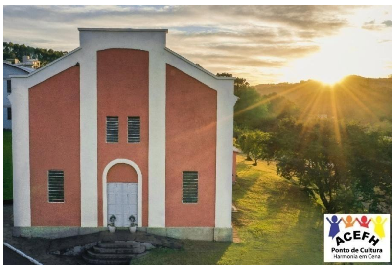
Figura 8: Sede da Associação Cultural e Esportiva Educando para o Futuro de Harmonia - ACEFH

A ACEFH foi fundada em 2006 a partir da mobilização de treze mães que queriam oportunizar a suas filhas, ainda crianças, aulas de ballet na cidade. Nessa época a cidade oferecia apenas aulas de futebol, as quais apenas os meninos poderiam participar, e coral, apenas para adultos. Diante dessa realidade, as treze mães se uniram e fundaram a associação, trazendo uma professora de ballet de fora do município para realizar aulas na cidade. Com o passar dos anos, a associação foi crescendo, tendo cada vez mais associados e oferecendo outras modalidades culturais além do ballet. Atualmente a ACEFH conta com 850 famílias associadas e oferece 26 atividades voltadas à cultura, educação e esportes.