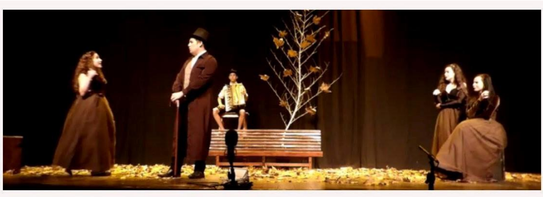
Figura 7: Alunos-atores do grupo de teatro Pura Arte no EARTE 2016 – Espetáculo “ A Menina e o Sanfoneiro”.