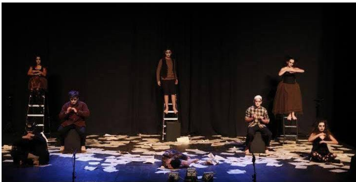
Figura 5: Alunos-atores do Grupo Teatral Pura Arte em cena com o espetáculo “Tudo aquilo que já se foi” no palco do EARTE – 2015

e incomodar. Todavia, a recepção foi ótima. O trabalho foi um sucesso, a escola, os pais dos alunos, os alunos-atores ficaram muito orgulhosos de seus trabalhos e eu também fiquei extremamente contente com os resultados alcançados. Muito Feliz por ter tido um estréia de sucesso que inclusive nos rendeu 4 prêmios no festival: Melhor Espetáculo, Melhor Direção, Melhor Trilha Sonora e Melhor Figurino.