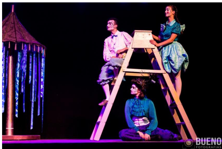
Figura 11: Alunos-atores do grupo Pegamôt em cena no espetáculo “Diário Inexistente”. (Foto: Acervo ACEFH - outubro de 2019).

resultados para o espetáculo. A peça foi diversas vezes premiada nos festivais em que participou, trazendo para Harmonia e para a ACEFH prêmios de Melhor Espectáculo, Melhor Atriz, Melhor Atriz Coadjuvante, Melhor Figurino, Melhor Iluminação, Melhor Direção e Melhor Texto Inédito.