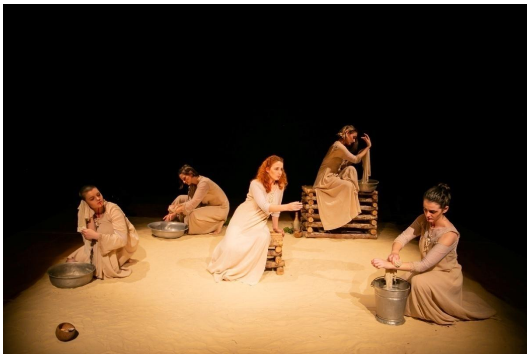
Figura 14: Foto divulgação do Espetáculo Filhas do Sal. 2019.