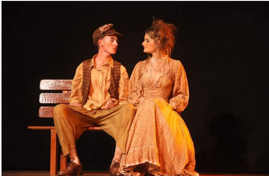
Figura 10: Alunos-atores do grupo Improviso em cena no espetáculo "Onde Vivem os Sonhos". (Foto: Acervo ACEFH - outubro de 2019).

O segundo grupo era o grupo " Pegamôt ". Diferente do primeiro grupo, este já estava em nível médio, os participantes já tinham algumas noções teatrais mais avançadas. O grupo era composto por alunos de 16 a 18 anos e logo no início tivemos alguns problemas quanto a possibilidade dos alunos-atores se manterem nas aulas de teatro, pois, muitos deles estavam iniciando suas vidas profissionais e acabavam por não conseguir conciliar os estudos, o trabalho e o teatro. Como muitos tiveram que sair do teatro, o grupo ficou bastante