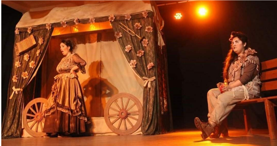
Figura 9: Alunas-atrizes do grupo Improviso, em cena no espetáculo "Onde Vivem os Sonhos". (Foto: Acervo ACEFH - outubro de 2019).