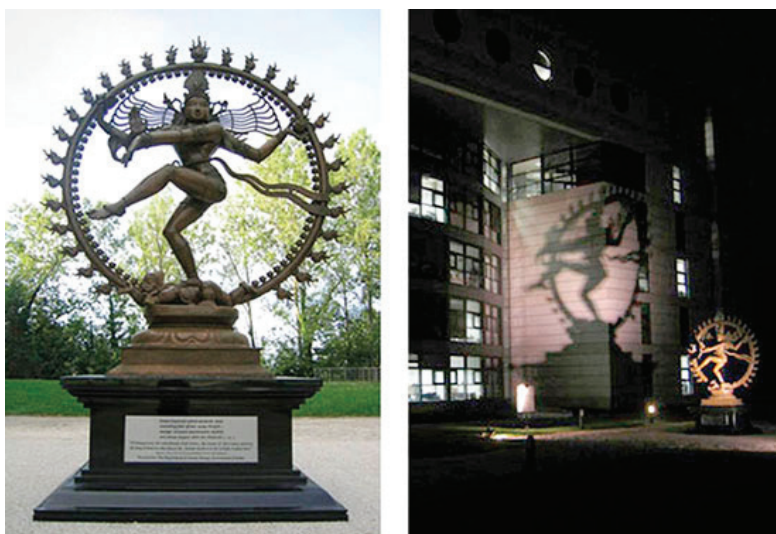
Figura 2: Estátua de Shiva no Cern, aludindo à metáfora de Capra ( http://www.fritjofcapra.net/shivas-cosmic-dance-at-cern/ )

Shiva é o deus da destruição nas tradições religiosas indianas. A destruição, nesse contexto, é entendida como elemento indispensável da realidade, pois traz a renovação, a possibilidade de renascimento. A imagem de Shiva e de sua dança foi proposta como uma metáfora para a realidade dinâmica que nos compõe, como no caso das constantes aniquilações entre partículas existentes na natureza, apontadas, por exemplo, pelo físico austríaco Fritjof Capra (2011) em seu livro O tao da física , escrito na década de 1970, no qual o autor faz uma série de paralelos entre a física moderna e o misticismo oriental. Em 2004, o Conselho Europeu para Pesquisas Nucleares (Cern, na sigla em francês) inaugurou uma estátua de Shiva no interior da instituição (Figura 2), mencionando o trabalho de Capra.