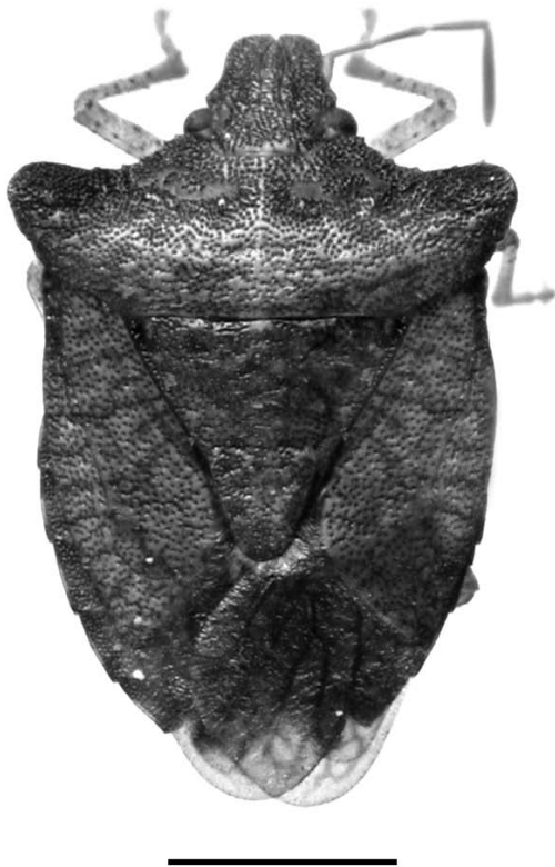
Fig. 1. Euschistus (Mitripus) irroratus , sp. nov.: holótipo macho, vista dorsal. Escala: 2 mm.

Genitália. Pigóforo com o bordo ventral escavado em "U" amplamente aberto, com terço mediano bi-sinuado (Figs. 3, 5). Taça genital com duas carenas laminares menos desenvolvidas que em E. (M.) paranticus , sendo que apenas as carenas dorsais são visíveis dorsalmente no pigóforo (Fig. 3). Parâmeros em forma de foice, com a região do pé mais alargada do que em E. (M.) hansii e