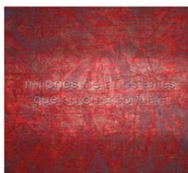
Figura 2 - Alicia Candiani. Não te preenchas de calma. Glicee, 100 x 80cm, 1998.