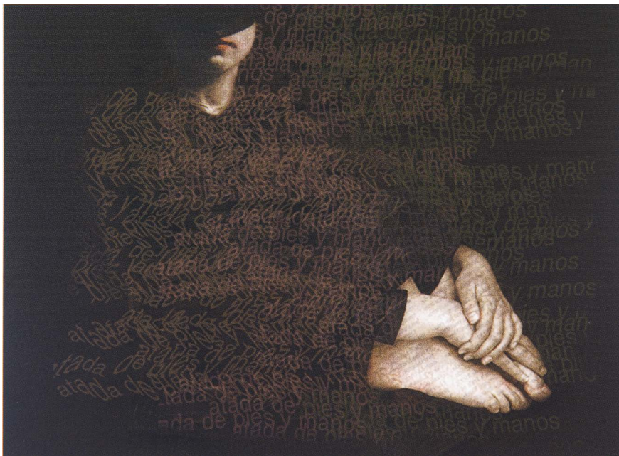
Figura 1 - Alicia Candiani. Mão e pé atados. Fotolitografia, 57x74cm, 1999.