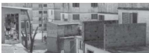
Vila Baronesa. Vista