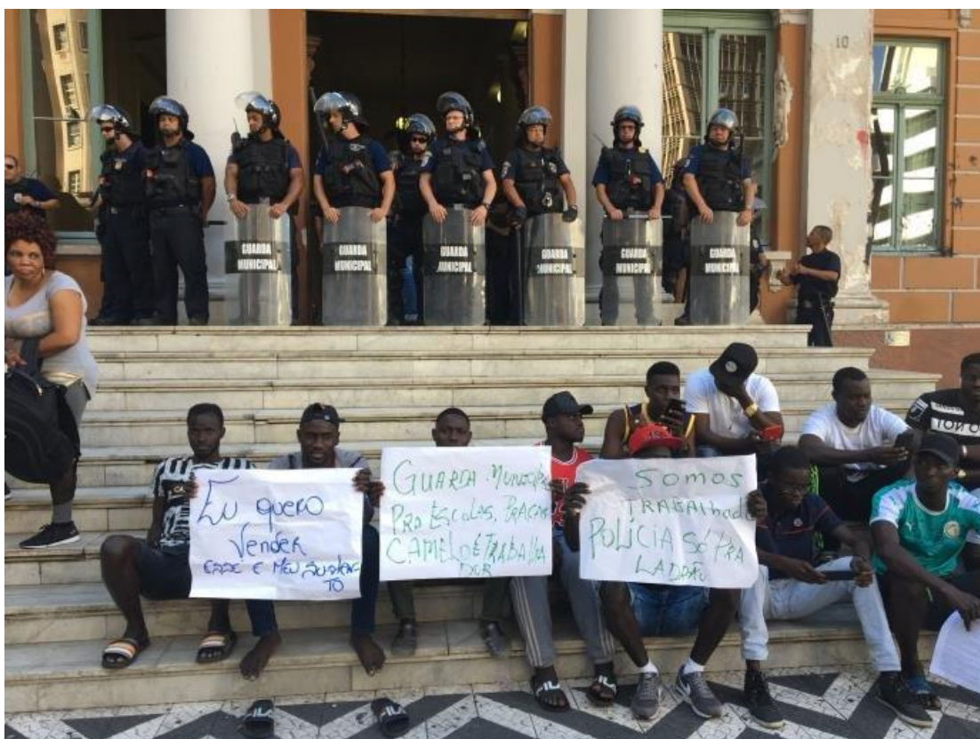
Protesto em frente à prefeitura de Porto Alegre.

Ainda que encontrando maiores dificuldades de atuação pelas fiscalizações e apreensões de mercadorias - que resultam não apenas no prejuízo pela perda dos produtos, mas também em uma maior gradação na escala de punições, aumentando