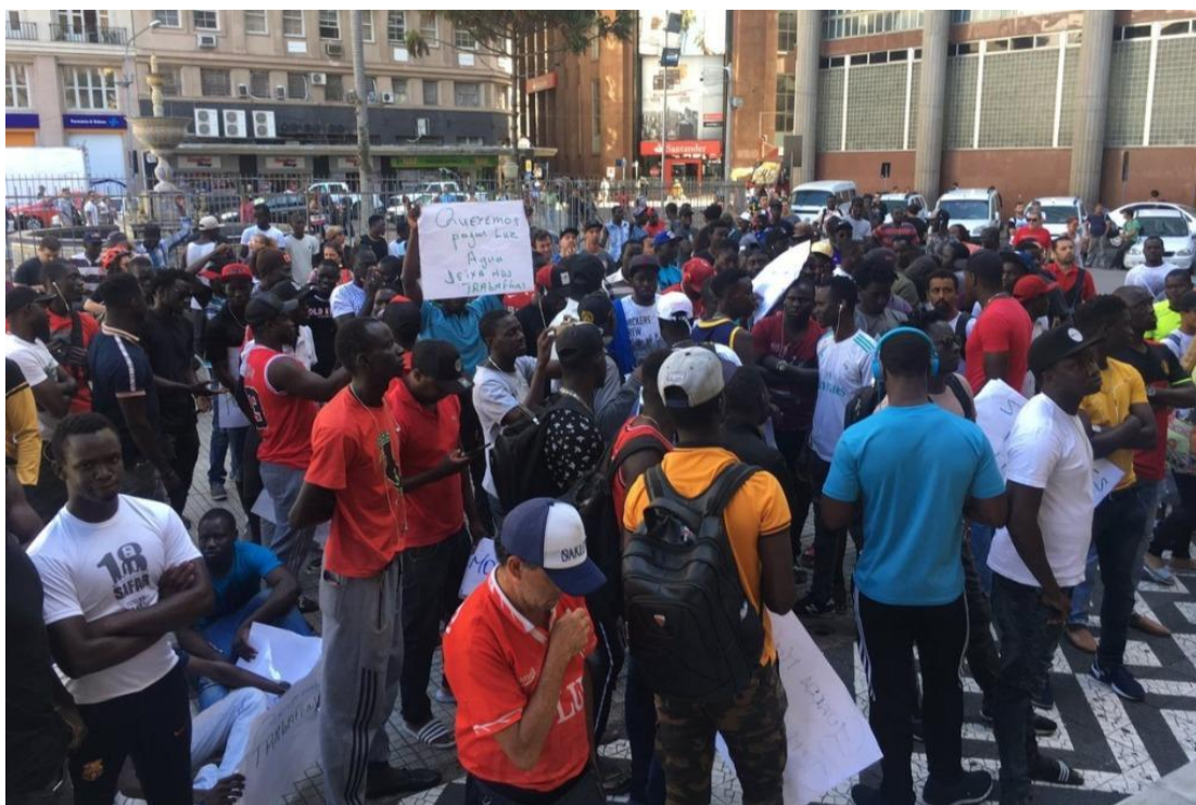
Protesto no centro de Porto Alegre.