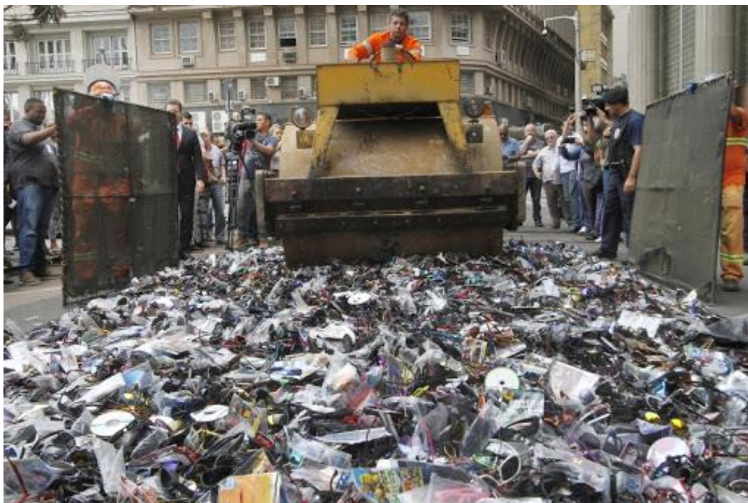
Objetos apreendidos destruídos.

As apreensões, ocorrendo com mais frequência e maior estrutura após a implantação do Movimento Legalidade, também se caracterizaram por utilizarem mais violência, especialmente em razão de envolverem instituições policiais que não possuem o treinamento e o preparo para a fiscalização nos moldes do que os agentes da SMDE realizavam anteriormente. Assim, protestos de vendedores ambulantes passaram a ser realizados no centro de Porto Alegre ao longo de 2017 e 2018, posicionando-se contrariamente à brutalidade das operações, especialmente após a circulação, nas redes sociais, de um vídeo em que um imigrante senegalês é agredido por um grupo de policiais durante a apreensão de suas mercadorias (MUNARI, 2018). Nessas manifestações, os imigrantes carregavam cartazes em que se lia: “Nos deixem trabalhar”, “Eu quero vender. Esse é o meu sustento”, “Camelô é trabalhador” e “Queremos pagar luz, água. Camelô não é bandido” .