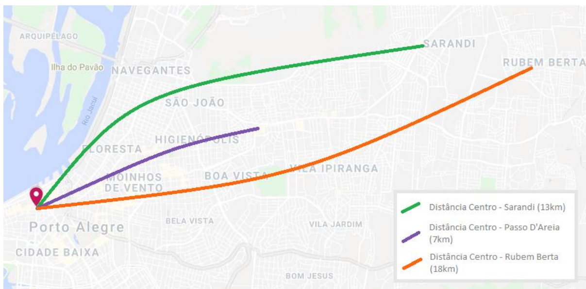
Mapa de distância ao centro dos bairros com maior concentração de imigrantes senegaleses.

Logo de início, a falta de documentação, a dificuldade em validar diplomas e a ausência de redes de contato prévias com grupos de imigrantes, aliadas às barreiras clássicas de inserção migrante nas sociedades de destino, dificultaram uma absorção rápida pelo mercado de trabalho formal porto-alegrense, razão pela qual muitos senegaleses passaram a apostar na informalidade do comércio de rua como forma de subsistência. Os imigrantes não chegam a competir diretamente com nativos no mercado de trabalho, eis que sua inserção laboral é geralmente marginal ou complementar, ocupando os postos remanescentes (GUILHERME, 2017, p. 31).