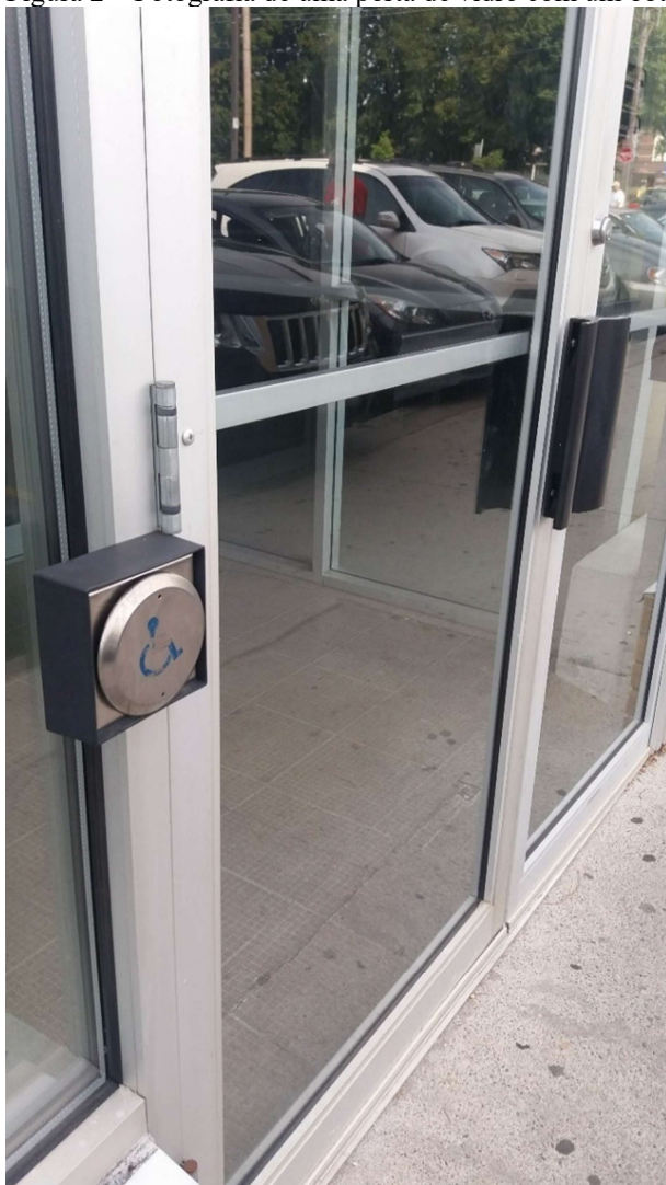
Figura 2 – Fotografia de uma porta de vidro com um botão para acionar a sua abertura na lateral esquerda

para abertura automática das portas de entrada e saída a lugares públicos como as estações de metrô, banheiros, shoppings, mercados, centros comerciais, centros comunitários, entre outros (como pode ser observado na Figura 2). É comum também deparar-se com mais de uma porta de entrada, uma principal e ao menos uma lateral com esse acionador para abertura automática. Muitos estabelecimentos canadenses possuem eclusas com portas duplas, para garantir que a temperatura abaixo de zero durante os meses de inverno não adentre os ambientes durante o fluxo de entrada e saída de pessoas. Por esse motivo, além de serem duplas, as portas costumam ser pesadas, o que faz com que o botão seja recorrentemente acionado por diferentes pessoas e não apenas aquelas com mobilidade reduzida. Era comum observar um fluxo contínuo de pessoas que mantinha a porta com o acionador constantemente aberta nas estações de metrô, por exemplo. A experiência do frio intenso faz pensar em uma necessidade de aparatos para suportar o meio e talvez produza uma sensibilidade à vulnerabilidade de nossos corpos.