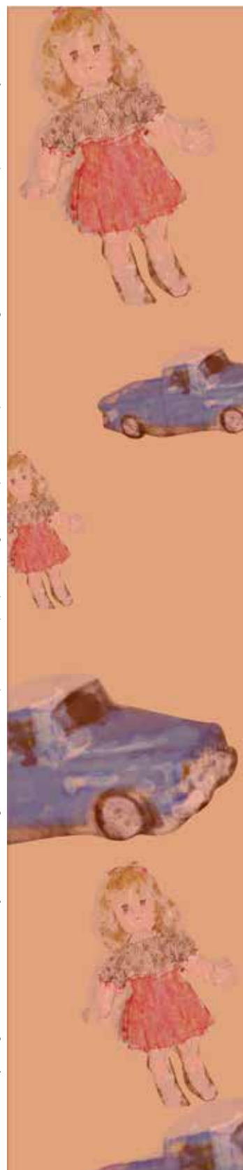
3 CARNEIRO, Suely. Enegrecer o feminismo: a situação da mulher negra na América Latina a partir de uma perspectiva de gênero. Disponível em: http://www.unifem.org.br/sites/700/710/00000690.pdf . Acesso em: jun. 2014.

TILLY, Louise. Gênero, História das Mulheres e História Social. Cadernos Pagu (3), Núcleo de Estudos de Gênero/UNICAMP, São Paulo, 1994.