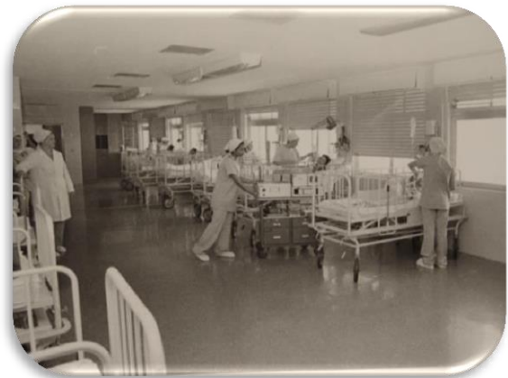
Equipe de Enfermagem Bloco Cirúrgico e Sala de Recuperação Pós Anestésica