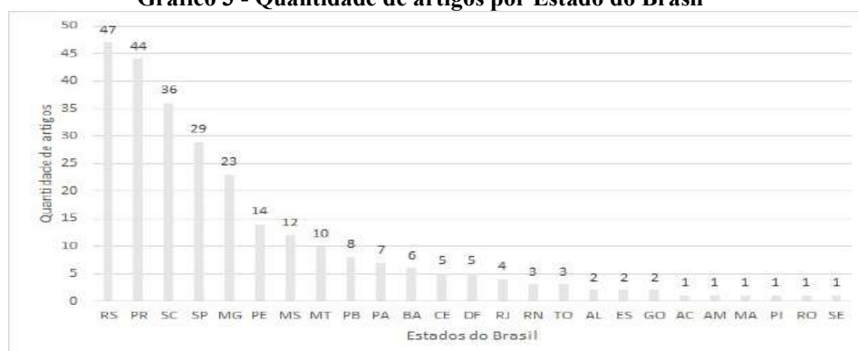
Gráfico 3 - Quantidade de artigos por Estado do Brasil

Da mesma forma, entre as publicações nacionais, buscou-se avaliar o número de publicações por Unidade de Federação do Brasil. O Gráfico 3 evidencia a quantidade de artigos publicados em cada estado brasileiro. Para essa análise, também foi considerada a localização da instituição de ensino a que o primeiro autor está vinculado no corpo do artigo.