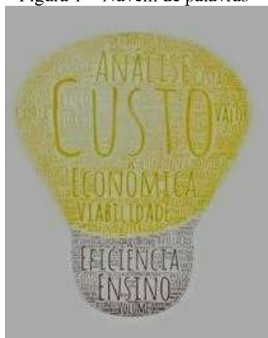
Figura 1 – Nuvem de palavras

Por fim, em busca de identificar tendências nas pesquisas realizadas, foram identificadas as principais áreas temáticas dos artigos publicados. Para a classificação da área temática, buscou-se verificar o assunto principal do texto. A identificação do tema ocorreu através da leitura do título, das palavras-chave e dos resumos dos artigos. A Figura 1 apresenta as palavras que compõem as áreas temáticas em destaque nos artigos analisados.