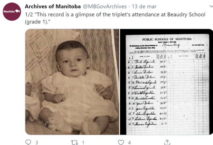
Figura 2 – Difusão de acervo no Twitter do Arquivo provincial de Manitoba.

Desse modo, é possível perceber que três condições são fundamentais para os arquivos públicos canadenses do ponto de vista da difusão: 1) ações culturais; 2) políticas e leis de acesso à informação; 3) estudos de usuários: especialmente os genealogistas. Essa afirmativa se verifica pela análise dos próprios sites das instituições exemplificadas.