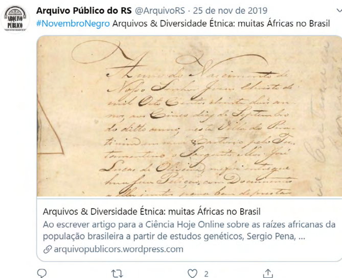
Figura 4 – Difusão do Arquivo Público do Rio Grande do Sul pelo Twitter.

Portanto, ações de difusão nas redes sociais também têm ocorrido com frequência nas instituições públicas brasileiras. Estabelecidas essas balizas teóricas em relação à trajetória do acesso e da difusão nos cenários