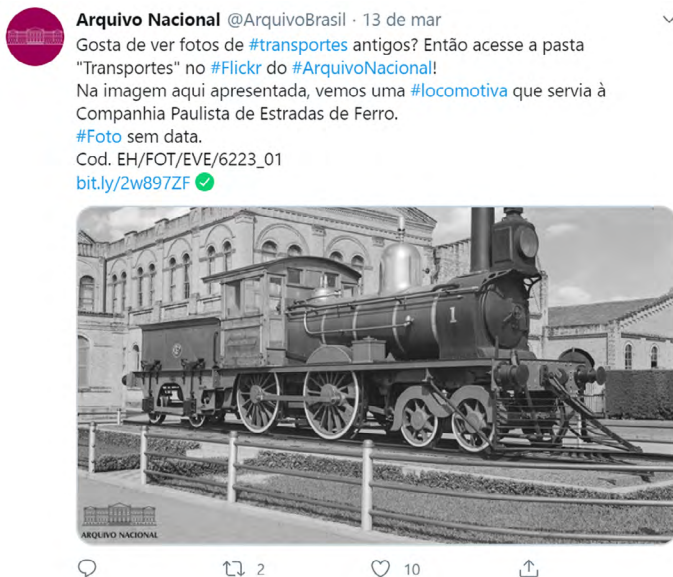
Figura 3 – Difusão do Arquivo Nacional do Brasil pelo Twitter.

porém carecia de regulamentação. Também foram verificadas, no Brasil, ações de difusão nas redes sociais, exemplificadas nas Figuras 3 e 4.