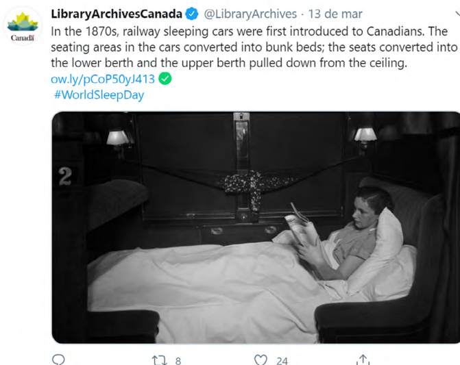
Figura 1 – Difusão de acervo no Twitter da Biblioteca e Arquivo Canadense.

Na grande maioria dos arquivos provinciais e no nível federal acontecem ações educativas e de difusão de acervo, sem uma preocupação muito grande de como poderiam ser organizadas ou definidas, ou seja, são realizadas de forma bastante genérica. Essas práticas também acontecem em redes sociais, como ilustrado nas Figuras 1 e 2, apenas para fim de exemplificação: