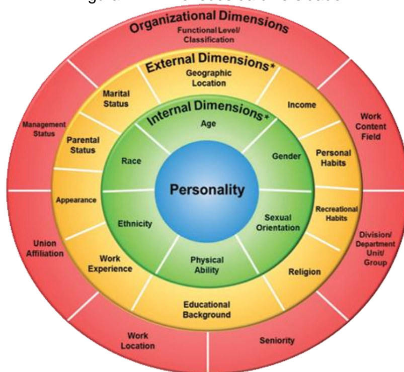
Figura 1 - Dimensões da diversidade