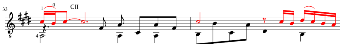
Figura 42: Romance del Diablo de Astor Piazzolla, arranjo de Bruno Duarte, c. 33-34.