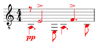
Figura 3: Verano Porteño de Astor Piazzolla, arranjo de Agustín Calevaro, c. 1.