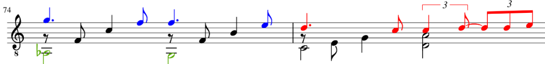
Figura 15: Invierno Porteño de Astor Piazzolla, arranjo de Sergio Assad, c. 74-75.

Apesar de não ser possível supor qual motivo levou Assad a alterar ritmicamente o seu arranjo (figura 15), podemos perceber que qualquer solução parecida com a que eu apresentei acima, causaria um impacto na sustentação das vozes. Esse trecho na gravação de Piazzolla é preenchido sonoramente pelos instrumentos, mesmo que não haja articulação nos contratempos, devido à natureza do som emitido.