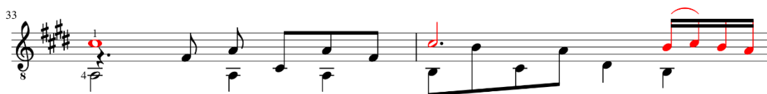
Figura 43: Romance del Diablo de Astor Piazzolla, arranjo de Bruno Duarte, c. 33-34.

Abaixo está representado um resultado similar com a ornamentação de Piazzolla, articulando apenas a nota dó# no compasso 34 (figura 43).