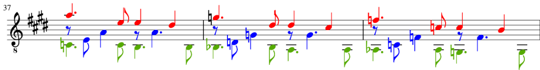
Figura 51: Romance del Diablo de Astor Piazzolla, arranjo de Bruno Duarte, c. 37-39.

Após as alterações serem aplicadas, obtive o seguinte resultado (figura 51):