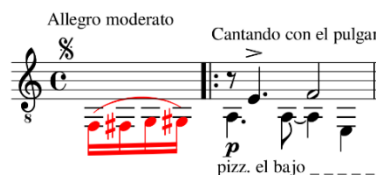
Figura 2: Verano Porteño de Astor Piazzolla, arranjo de Baltazar Benítez, c. 1.