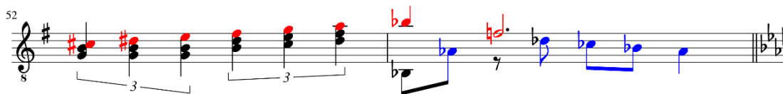
Figura 31: Romance del Diablo de Astor Piazzolla, arranjo de Bruno Duarte, c. 52-53