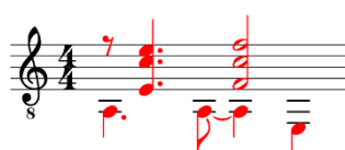
Figura 4: Verano Porteño de Astor Piazzolla, arranjo de Cacho Tirao, c. 1.