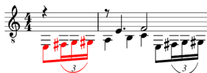
Figura 1: Verano Porteño de Astor Piazzolla, arranjo de Sergio Assad, c. 1.

Essa diferença também pode ser observada nos diferentes arranjos da obra, como visto abaixo (figuras 1 e 2):