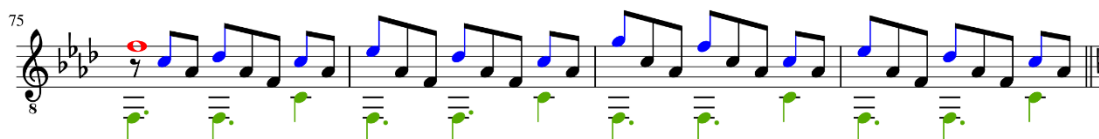
Figura 59: Romance del Diablo de Astor Piazzolla, arranjo de Bruno Duarte, c. 75-78.