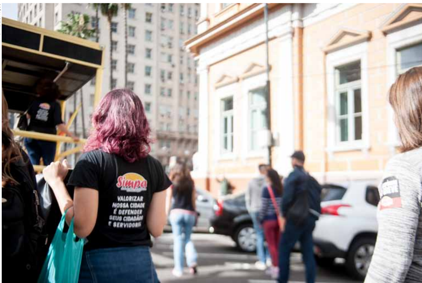
Servidores públicos municipais em greve participam de manifestação contra medidas anunciadas pela Prefeitura da capital