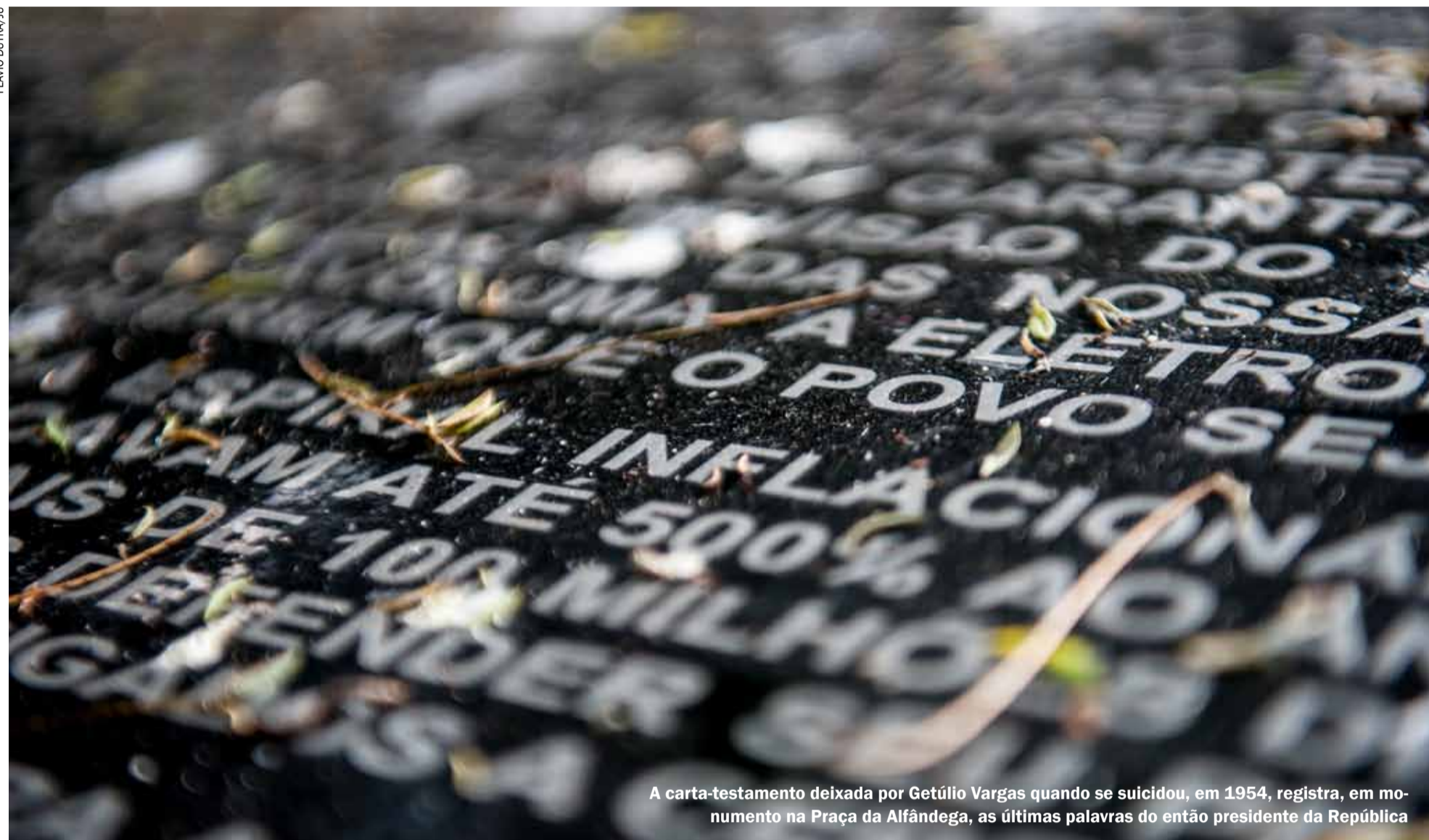
A carta-testamento deixada por Getúlio Vargas quando se suicidou, em 1954, registra, em monumento na Praça da Alfândega, as últimas palavras do então presidente da República