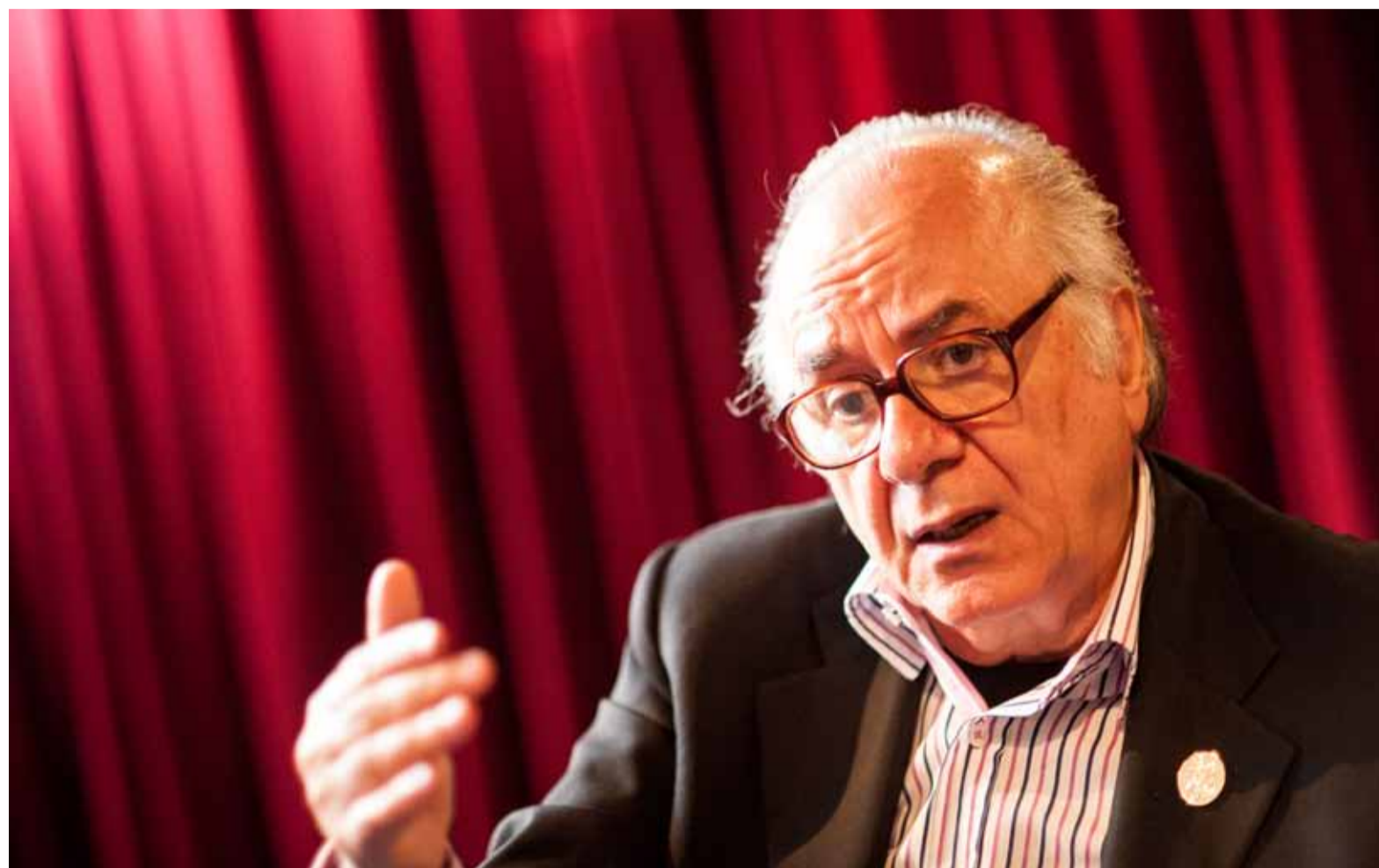
FLAVIO DUTRA/JU/ARQUIVO 08/09/2014

Os portugueses viveram nos quatro anos anteriores (2011-2015) um pesadelo conservador. Um governo de direita ultra-neoliberal tentou destruir as conquistas sociais obtidas depois da Revolução de 25 de abril de 1974, que pôs termo a 48 anos de ditadura. Direitos dos trabalhadores foram atacados, salários e pensões foram cortados, fizeram privatizações, a começar pelo Serviço Nacional de Saúde. O povo empobreceu, enquanto o número de bilionários não cessou de aumentar. Sob o pretexto de imposições externas da União Europeia e do FMI – imposições reais, mas que podiam ser executadas com prudência –, puseram em prática o programa de governo de direita, ainda mais austeritário que o imposto pela tutela