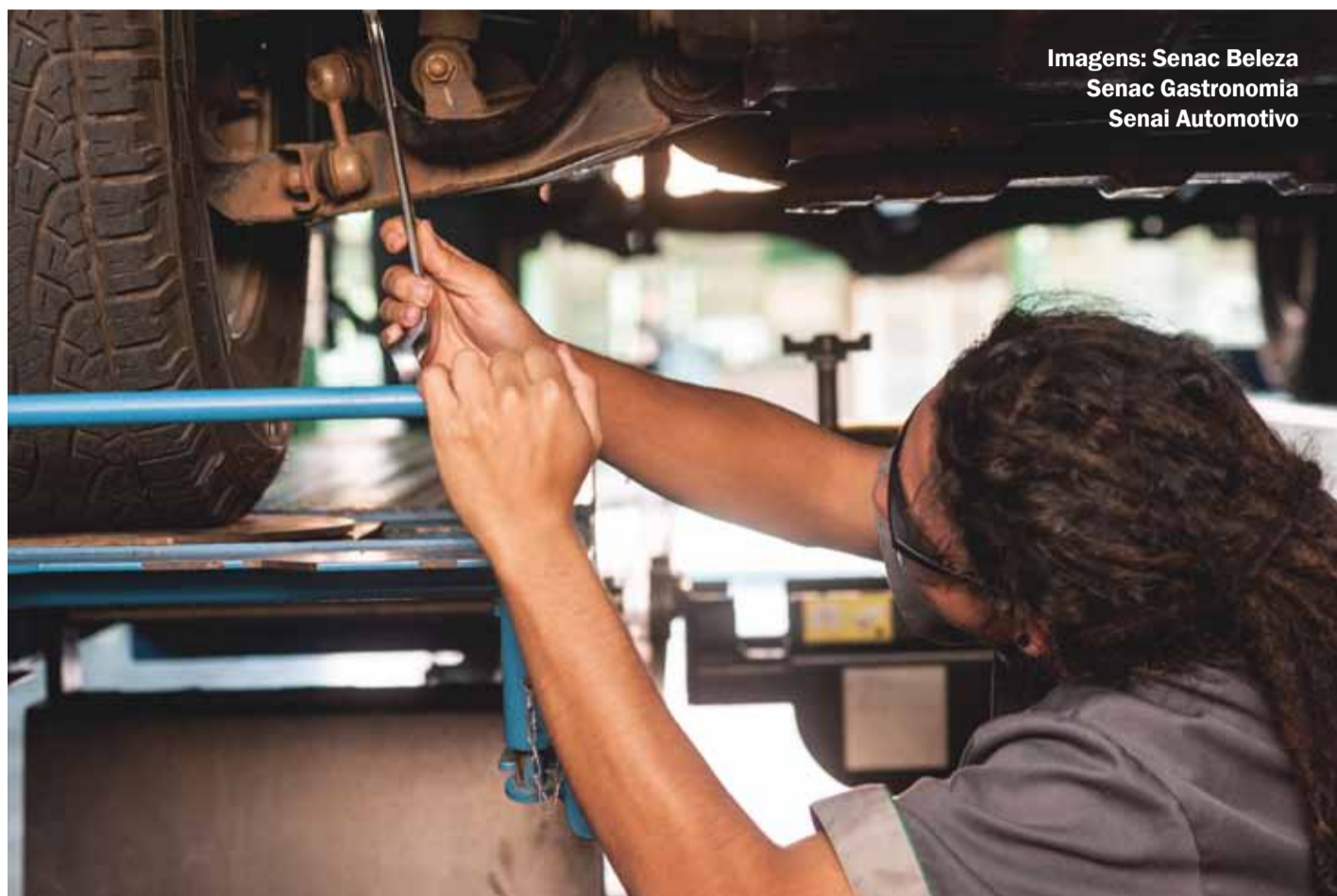
Imagens: Senac Beleza Senac Gastronomia Senai Automotivo

em relação à transparência. O TCU verificou que os órgãos auditados tendem a cumprir estritamente o que dispõe a Lei de Diretrizes Orçamentárias (LDO) quanto à divulgação dos gastos e das despesas. Porém, as informações relativas às licitações apresentadas nos sítios eletrônicos estavam incompletas e as que foram encaminhadas ao Tribunal continham campos em branco ou preenchidos com erros.