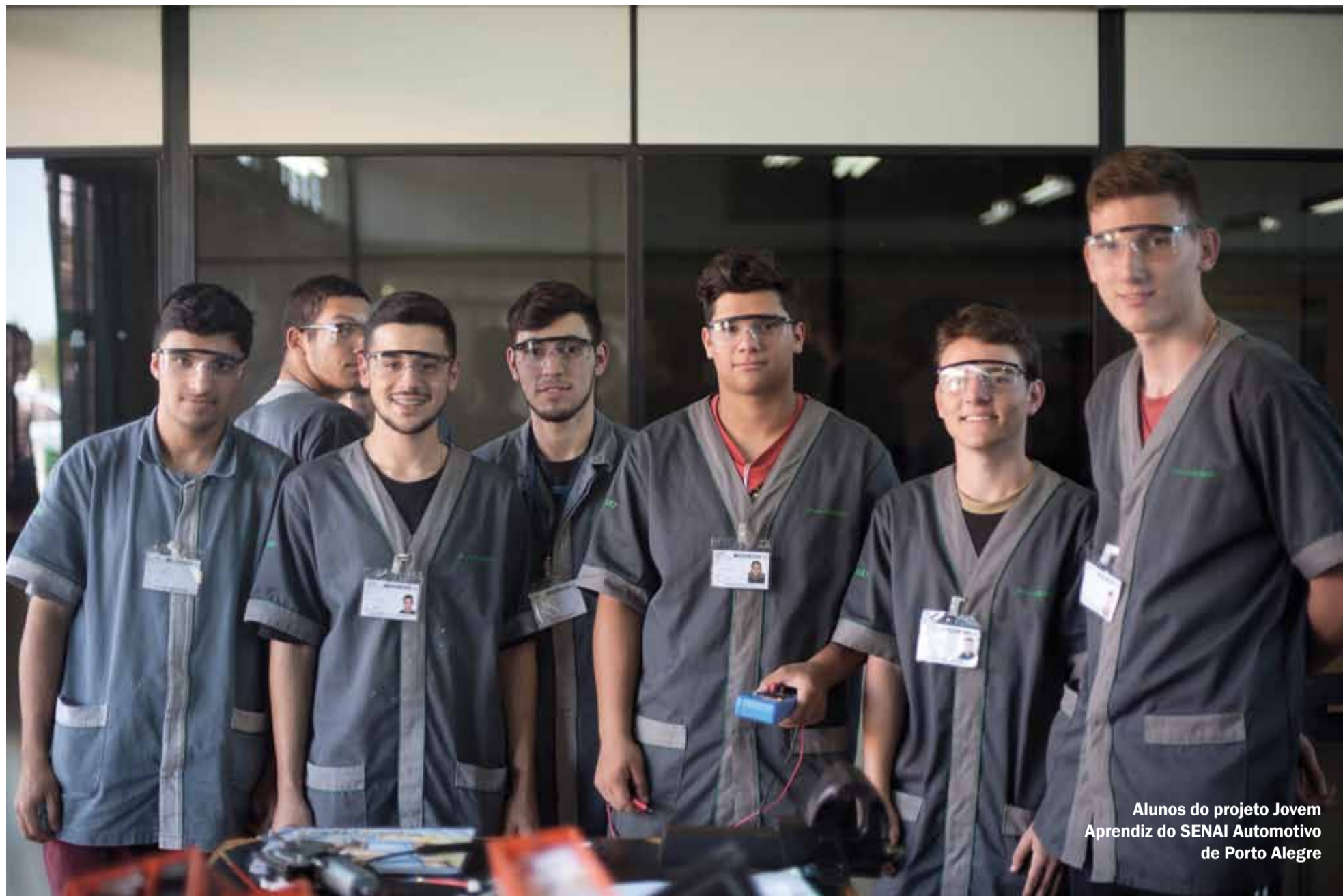
Alunos do projeto Jovem Aprendiz do SENAI Automotivo de Porto Alegre