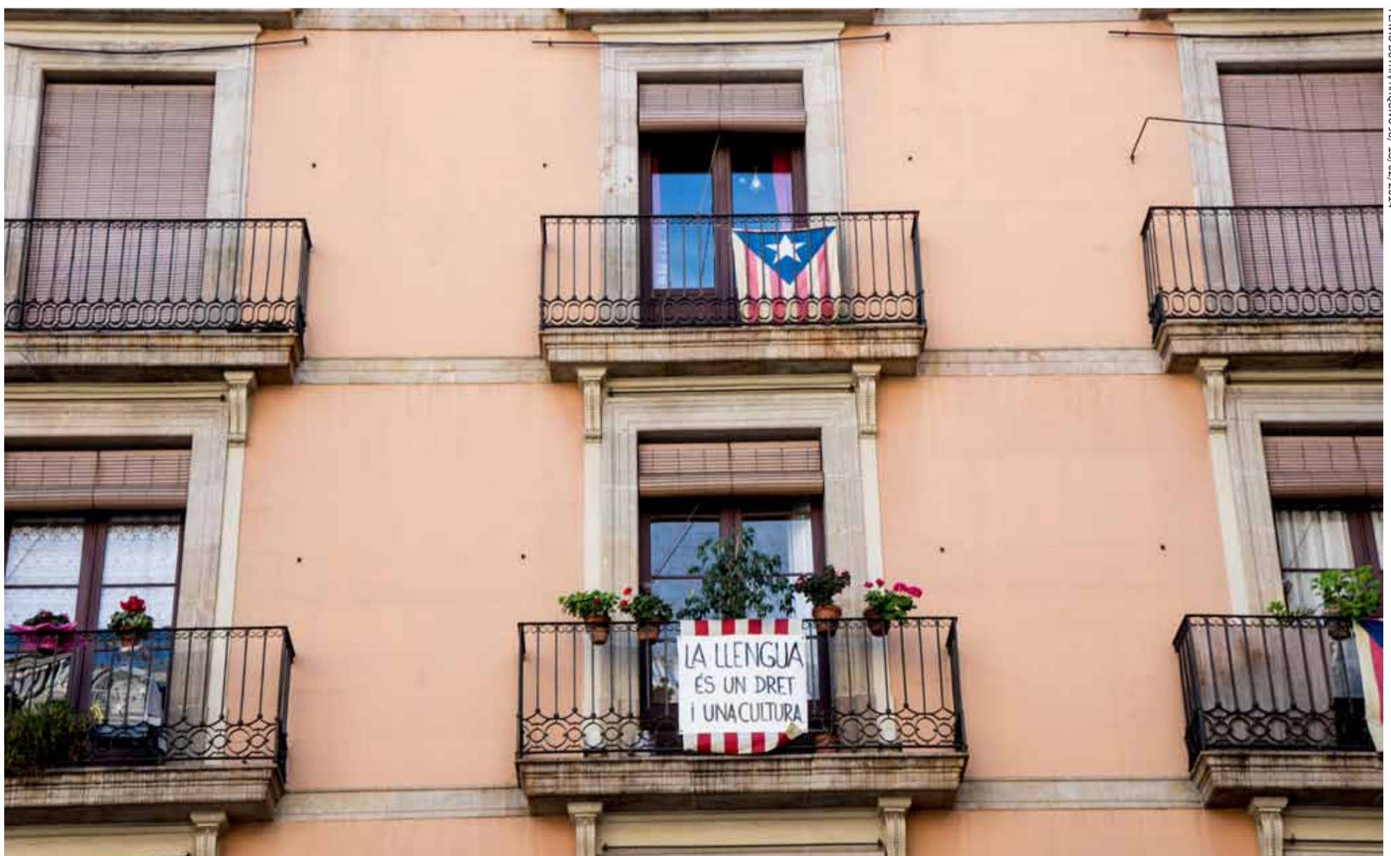
Em Barcelona, capital da comunidade autônoma da Catalunha, cartazes registraram demonstrações de apoio à independência da região em relação ao governo espanhol