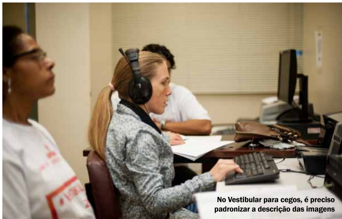
No Vestibular para cegos, é preciso padronizar a descrição das imagens

O ato de aferição ocorre antes da criação de vínculo. Será individual e silencioso. “O fenótipo fala por si só”, argumenta Edilson. Num eventual recurso de indeferimento poderão ser agregadas variáveis não fenotípicas justificadoras da autodeclaração.