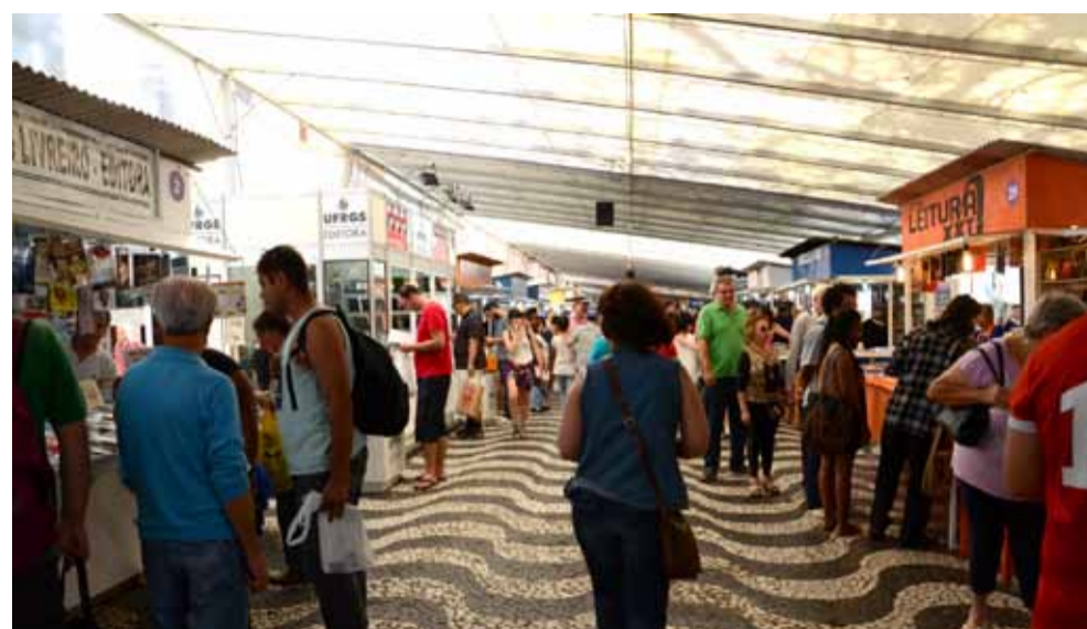
CADINHO ANDRADE/ARQUIVO SECOM/09/11/2015

De 1.º a 19 de novembro, a Editora da UFRGS participará de mais uma edição da Feira do Livro de Porto Alegre. Neste ano serão cerca de 450 publicações de diversas áreas do conhecimento disponíveis ao público na banca 38 (Av. Sepúlveda). Entre essas, 18 títulos novos serão lançados durante sessões de autógrafos e painéis: