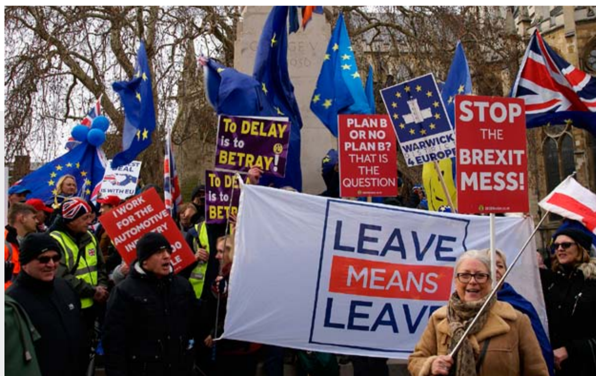
Em janeiro deste ano, novas manifestações aconteceram na Grã-Bretanha em razão do Brexit