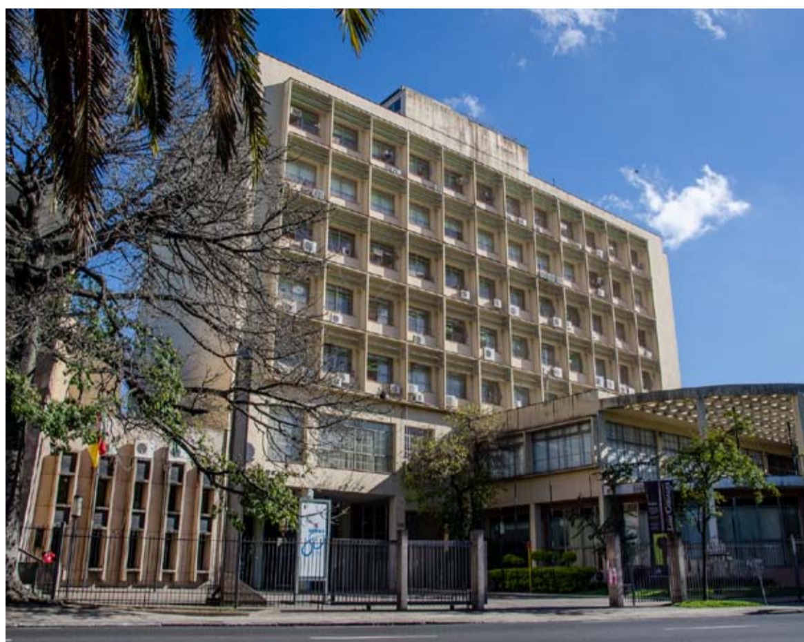
RAMON MOSER/ARQUIVO SECOM - ABRIL 2014

respostas, foi criado um grupo de trabalho para estudar as necessidades de capacitação desse público, bem como das lacunas no desenvolvimento de competências importantes, conforme os organizadores. Uma segunda edição da pesquisa está sendo planejada para este ano.