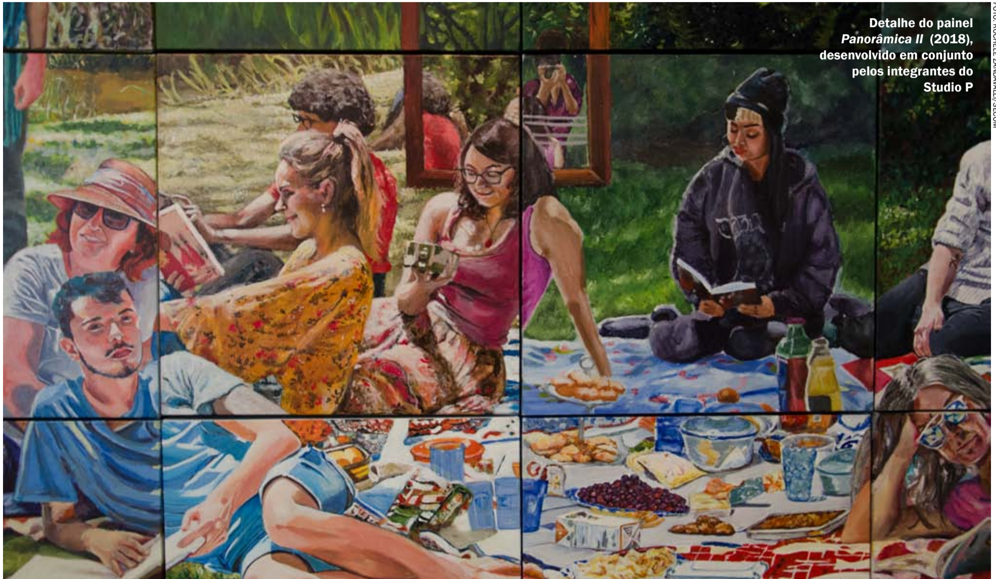
Detalhe do painel Panorâmica II (2018), desenvolvido em conjunto pelos integrantes do Studio P