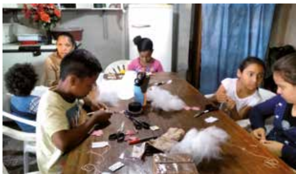
Figura 1 - Desenvolvimento de habilidades para o trabalho.

Situado na zona norte de Porto Alegre, o bairro Mario Quintana é uma mistura entre o rural e o urbano, presentes em cada rua e esquina. A comunidade conta com escolas municipais e estaduais de educação básica e é servida por diversas rotas de ônibus. Bem asfaltadas e sinalizadas, as ruas do bairro possuem um próspero comércio. Apesar dessas facilidades, a região apresenta um nível de violência acentuado, conjugado com o avanço alarmante do tráfico de drogas e furtos, aumentando consideravelmente o número de crianças e adolescentes envolvidos em delitos. Essa situação justifica um projeto de atenção a esses jovens, voltado ao desenvolvimento de habilidades para o trabalho, autoestima e senso de cidadania.