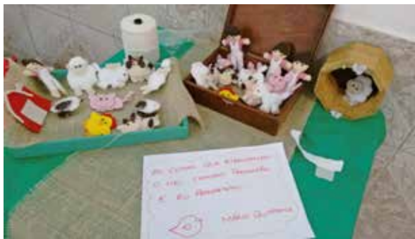
Figura 6 - Todos os personagens prontos

Depois de finalizarmos todos os personagens da Fazenda do Mário, iniciamos a construção da história coletiva. Nossa proposta foi juntar os personagens numa jornada, na ordem em que esses iam sendo confeccionados. Entretanto, essa ideia não foi aceita pelo grupo, e as crianças preferiram construir a história do seu jeito, depois de todos os personagens prontos. Juntando todas as ideias, foi concebida a seguinte história: