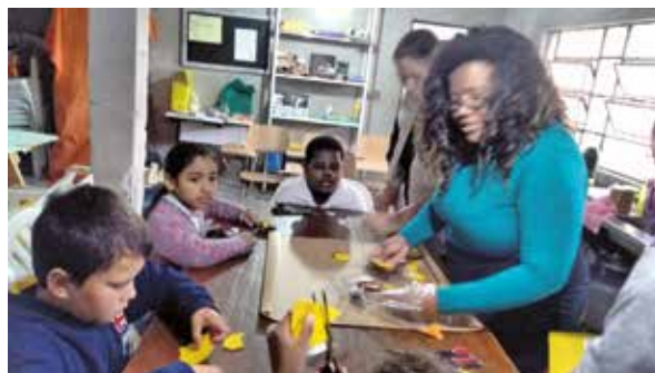
Figura 2 - Confeção do passarinho

No encontro seguinte, treinamos o ponto alinhavado com barbante e cartolina, e os participantes aprenderam a colocar a linha na agulha. Percebemos os alunos muito motivados com a possibilidade de produzirem seus próprios brinquedos. Logo após, as crianças receberam as peças do passarinho e o confeccionaram. Todos foram encorajados a completar a tarefa com capricho e criatividade.