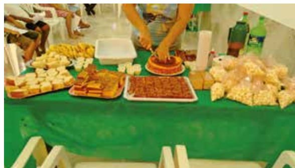
Figura 7 - Encontro final preparado pelas mães

Durante todo o projeto, estiveram presentes nas oficinas as mães dos alunos. Havia mães que ficavam apenas alguns minutos, enquanto que outras chegavam antes e permaneciam durante as oficinas, auxiliando na aula, distribuindo os materiais, servindo os lanches (muitas vezes traziam o alimento), ajudando as crianças quando necessário, e contribuindo na organização da sala e limpeza das mesas. Realmente, foi muito importante a participação das mães durante o curso. Elas também nos forneciam um retorno das mudanças de comportamento das crianças e das observações das professoras sobre os alunos. Esse retorno foi fundamental como motivação, tanto para nós quanto para os alunos.