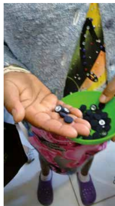
Figura 5 - Visita ao ateliê de costura