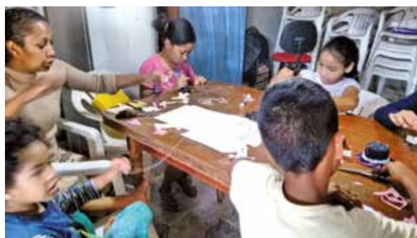
Figura 3 - Cena de concentração e engajamento

No encontro subsequente, os alunos confeccionaram uma ovelha de feltro e foram desafiados a costurar as miçangas nos olhos dos animais criados. Verificamos nessa aula o quanto um dos participantes estava engajado em sua tarefa. Na ocasião, o pai desse aluno foi buscá-lo durante a oficina para ir passear. O aluno negou-se a sair, chorando e mostrando-se muito chateado com o pai, que foi forçado a esperar a conclusão da tarefa.