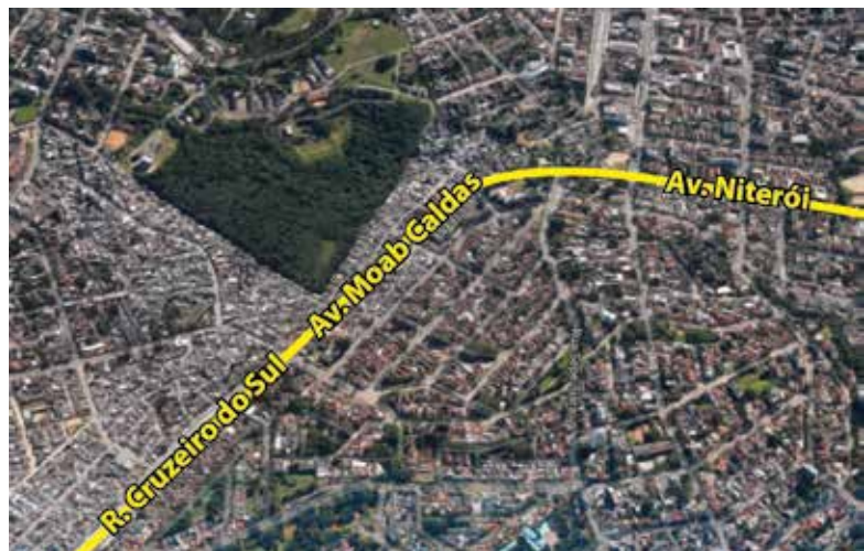
Figura 1: Trecho de duplicação da Avenida Tronco

A feitura das ações extensionistas em campo possuem dois momentos: iniciamos nossa atividade através da observação participante com as turmas em uma escola municipal, uma escola estadual e um Serviço de Apoio Socioeducativo (SASE), articuladas com nossa participação na Rede de Proteção (vinculada à Microrregião 5 do Conselho Tutelar) e a Redinha (Cruzeiro) e num segundo momento atuamos em forma de oficinas.