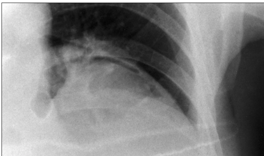
Figura 1. Grande opacidade esférica, densa, no lobo inferior. Presença de ar em forma de crescente, externamente à membrana, representando início de fístula entre brônquio e a cavidade que aloja o cisto.

O paciente foi, posteriormente, submetido a lobectomia inferior esquerda, tendo apresentado boa evolução clínica. O estudo anatomopatológico demonstrou a presença de membrana hidática com marcada reação inflamatória pericística supurativa, confirmando, dessa maneira, o diagnóstico de cisto hidático pulmonar.