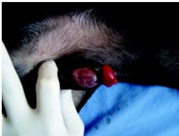
Figura 2. Fimose em canino S.R.D.