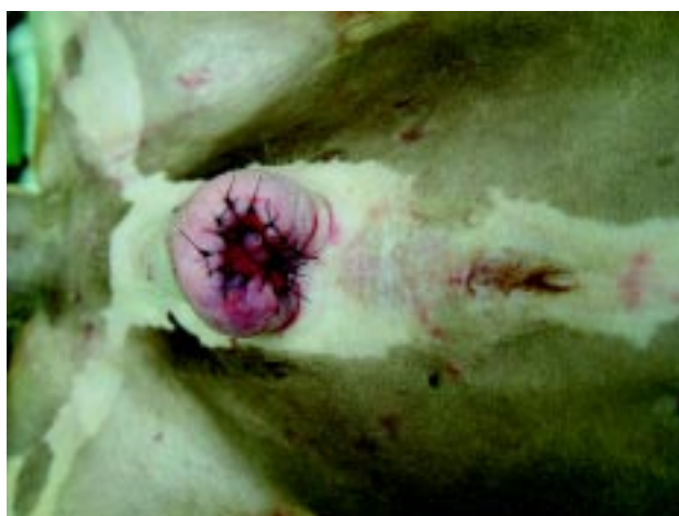
Figura 4. Resultado imediato após sutura com pontos simples iso.