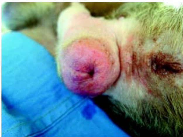
Figura 1. Fimose em canino American Staffordshire.