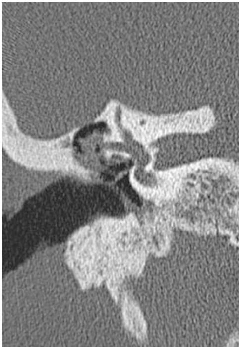
Figura 1 FL (canal semicircular lateral) em uma tomografia computadorizada (TC).