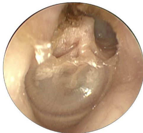
Figura 2 Colesteatoma Epitimpânico Posterior.

A prevalência da FL em pacientes com colesteatoma e queixa de vertigem foi de 5,6% e naqueles sem esse sintoma foi de 1,0% ( p = 0,03 ). A razão de prevalência da FL entre pacientes com e sem vertigem foi de 2,1. A prevalência da FL em pacientes com CEP e colesteatoma de dupla via foi de 5,0% e no colesteatoma remanescente os padrões de crescimento foram de 0,6% ( p = 0,16 ). As figuras 2 e 3 demonstram, respectivamente, um CEP e um colesteatoma de dupla via, os quais foram a causa da FL nesses pacientes. A taxa de prevalência da FL entre colesteatomas que afetaram o ático