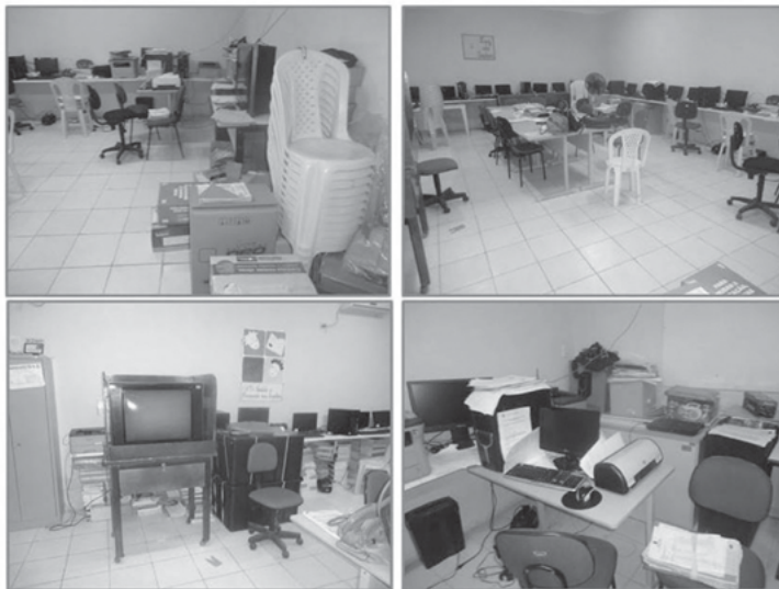
Figura 1 - Laboratório de Informática da Escola X - 2013

As imagens acima foram capturadas durante o pré-teste do questionário do Modelo e-Maturity (e-M) 3 . Das cinco escolas participantes do pré-teste, quatro apresentavam seus laboratórios em situação bastante desorganizada, fator que dificulta o uso das TIC numa ação pedagógica. Isso se comprova com o resultado apresentado pelo teste-piloto, em que a média geral obtida entre as escolas participantes foi 2,17, numa escala de 1 a 5. Esse resultado informa que as escolas investigadas encontram-se num estágio receptivo em relação à gestão tecnopedagógica; isso implica dizer que, nas escolas participantes, o uso das TIC em atividades pedagógicas ainda é instrumental e instrucional.