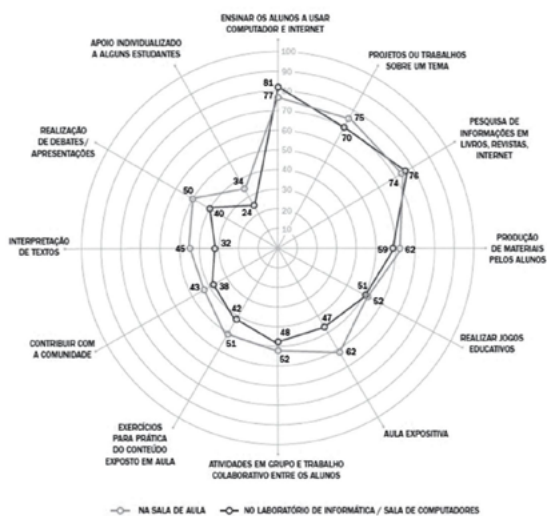
Gráfico 1 - Local de realização X uso do computador e da Internet com os alunos

Essa metodologia se configura como bastante instrumental, o que provoca uma subutilização do potencial das TIC para o processo de ensino e aprendizagem. O ponto positivo é o avanço na utilização das TIC para o desenvolvimento de projetos, atividades em grupo e colaborativas, pesquisas. “Embora a infraestrutura tecnológica não tenha atingido a sala de aula, esse ambiente se destaca como um importante espaço para o desenvolvimento das atividades que contam com a aplicação das TIC” (CETIC, 2011, p. 105).