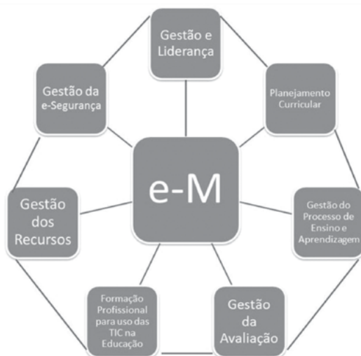
Figura 2 - Sete dimensões da e-maturity - 2013

A ideia é oferecer subsídios para que a gestão desenvolva uma prática pedagógica em confluência com os novos paradigmas da era digital, direcionada para melhoria dos resultados educacionais.