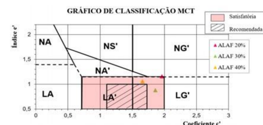
Figura 2 - Gráfico da classificação MCT dos materiais

Analisando os resultados da Tabela 1, percebe-se que quanto maior a quantidade de resíduo menor é o valor do limite de liquidez e plasticidade, obtendo semelhantes índices de plasticidades, e índices de grupo com queda do valor quanto maior porcentagem de resíduo. Quanto a classificação MCT, apresentada na Figura 2, os dados evidenciam uma diminuição da latericidade do material com porcentagem de 40% de resíduo, para ALAF30% e uma anormalidade na ALAF20% nesta questão.